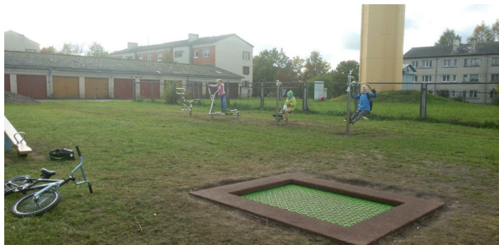
Attēls: Batuts, līdzsvara šūpoles un trenāžieri Slampes daudzdzīvokļu māju pagalmā

Projekta ietvaros Slampē, daudzdzīvokļu māju pagalmā (Tukuma novads, Slampes pagasts), uzstādīti brīvdabas trenāžieri un sporta aprīkojums – āra trenāžieris, kas paredzēts visām muskuļu grupām, pievilksnās āra trenāžieris, kāju atspiešanas trenāžie-