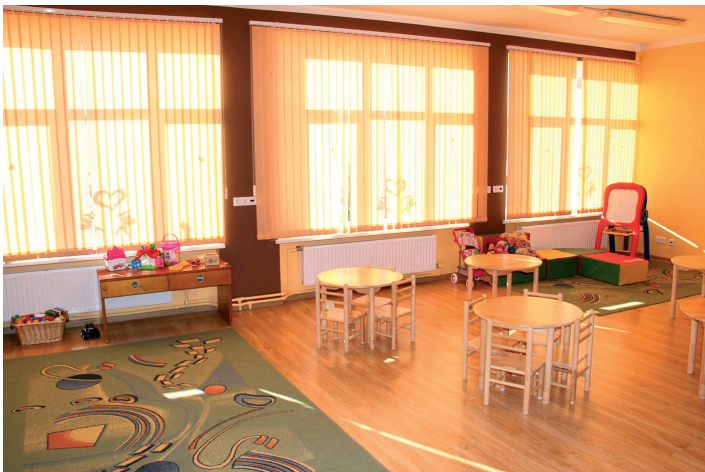
Pūres bibliotēkas bijušajās telpās iekārtota papildu bērnu darba telpa "Zemenīte" grupa

Pārskata periodā svarīgākais saimnieciskajā jomā bija Pūres veselības centra un bibliotēkas darba uzsākšana jaunās telpās ēkā "Pūre 18", kā arī papildu grupas izveidošana pirmsskolas izglītības iestādē "Zemenīte". Līdz ar to ir īstenots pirmais Mājoņu darba grupas virzītais projekts.