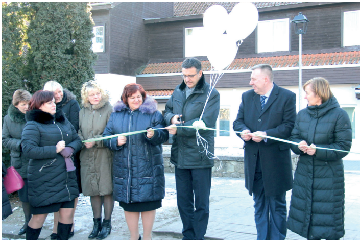
Atklājot Pūres veselības centra un bibliotēkas jaunās telpas, lentu griež labklājības ministrs Jānis Reirs