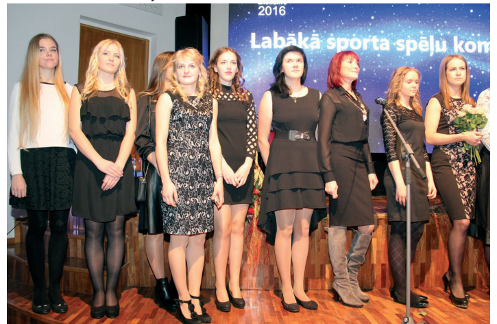
Sieviešu florbola komanda "Irlava/Tukums" – labākā sporta spēļu komanda