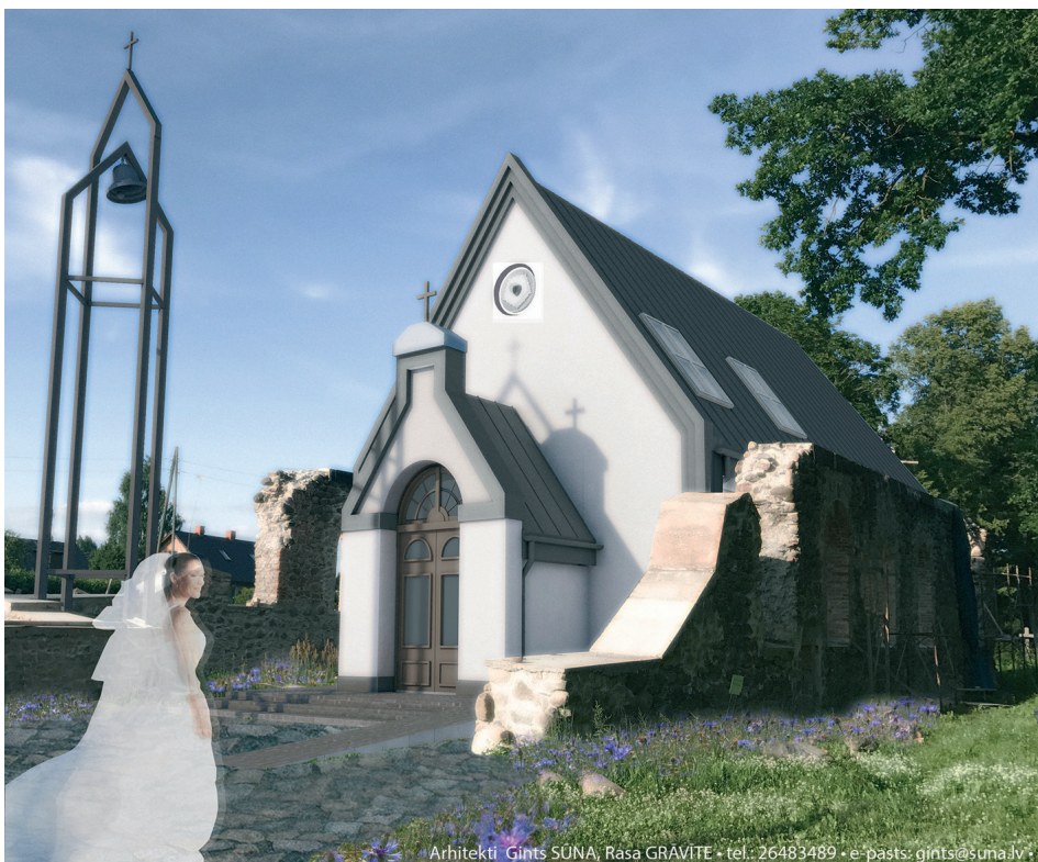
Šāda paredzēta jaunā Džūkstes baznīca

Džūkstes baznīcas atjaunošana ir arī kā dāvana Latvijas simtgadei, un visi sapņā par baznīcas atdzimšanu lolotāji pauž cerību, ka jau 2018.gada 18.novembrī tur varēs noturēt Latvijas simtgadei veltītu dievkalpojumu.