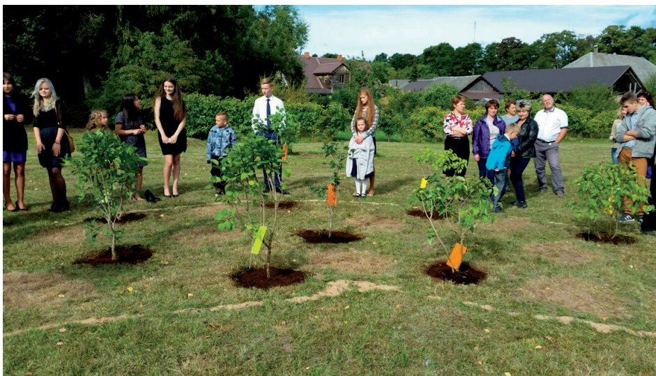
Meža diena Džūkstē, Pasaku tēva A. Lerha-Puškaiša parkā

Vairums koku stādi iegādāti ar Valsts atbalstu meža nozares attīstībai 2017.gadā, bet Tukuma pilsētas parkam Eiropas bal-