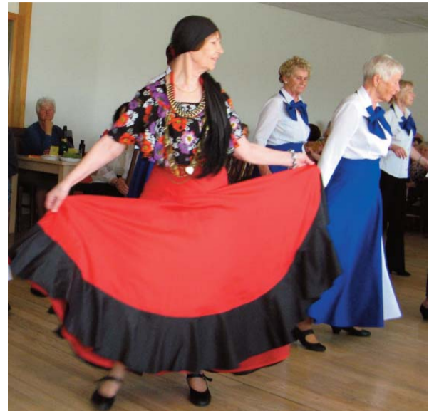
Skatītājus priecē līnijdejojāšu kolektīvs “Kamenes”.

Pēc biedrības priekšsēdētājas L. Lukšas uzrunas sekoja koncerts. Pirmie savu sniegumu rādīja deju kopa “Vēlreiz” (vadītājs V. Drunka). Kungu drošo roku vadītas, dāmas ļāvās “Sniega un uguns” valsim, krāšņajām koraļļu krāsas kleitām virmojot. Ja darbi