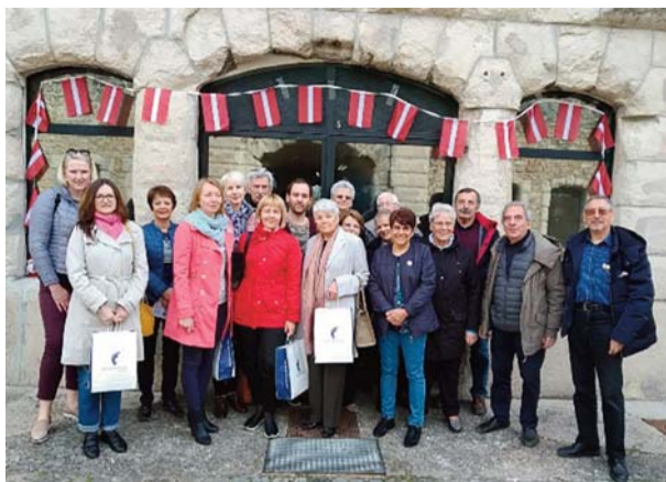
Tukuma novada delegācijas pārstāvji kopā ar Šenevjēras pašvaldības un sadraudzības komitejas pārstāvjiem

Pagājušajā gadā Tukumu apmeklēja jauniešu delegācija