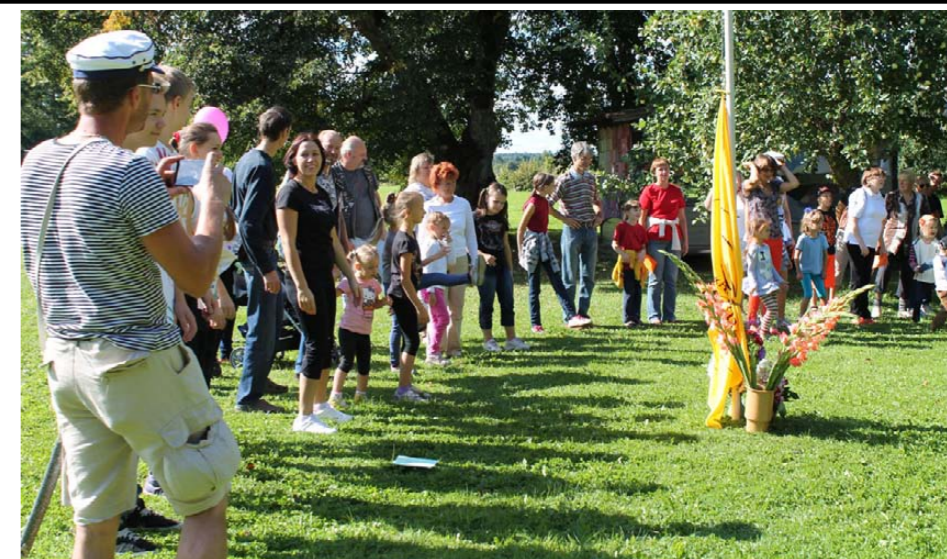
Komandas gatavojas startam

pusdienām vislabākais notikums ir... uzvarētāju apbalvošana! Te nu ir neiespējami nosaukt atsevišķus uzvarētājus un atsevišķas ģimenes, jo daudzas komandas tapušas tepat, uz vietas (vai, draugiem, kaimiņiem un klasesbiedriem iepriekš vienojoties telefoniski). Un tam jau arī nav lielas nozīmes, jo balvas saņem teju visi! Nominācijas ir skanīgas un visu izsaka pašas par sevi: balvas saņem Jaunākā, Jautrākā, Kuplākā, Radošākā, Skajākā,