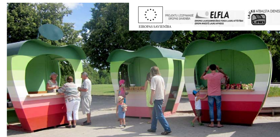
Tirdzniecības nojumes pie veikala „Abava” Pūres pagastā

Projekta kopējās izmaksas ir Ls 9 437,94, tajā skaitā attiecināmās izmaksas – Ls 7 747,04, no kurām 90% jeb Ls