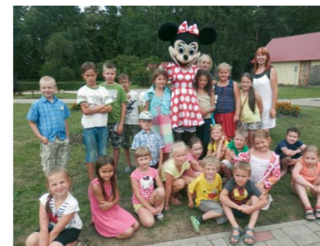
Bērnu mākslas nometnes dalībnieki kopā ar Mikijepeli

Irlavā 14.reizi notika bērnu mākslas nometne, kurā savas radošās spējas pilnveidoja 25 bērni.