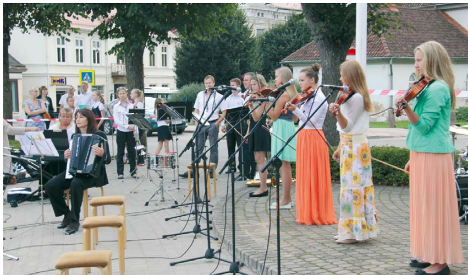
Lielformāta glezna vides objektu atklāšanas koncerts Brīvības laukumā festivāla „Pastaigas Tukumā” ietvaros

Par naudas līdzekļiem. Uz 2013.gada 20.augustu iedzīvotāju ienākuma nodoklis (IIN) gada plāns izpildīts par 68,95% (+2,28% no plānotā). Tas ļauj droši prognozēt, ka IIN plānotā izpilde būs lielāka par 3,5%, kas nodrošina pašvaldības budžetā plānoto darbu izpildi. Arī nekustamā īpašuma nodokļa iekasēšana tiek veikta atbilstoši plānotajam.