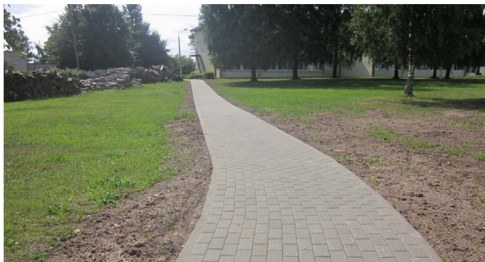
Gājēju celiņš no pagasta pakalpojuma centra

Kopējās projekta izmaksas ir Ls 21 688,14, tajā skaitā attiecināmās izmaksas – 8 956,86, no kurām 90% ir Eiropas Zivsaimniecības fonda finansējums – Ls 8 061,17 un 10% jeb Ls 895,69 ir pašvaldības budžeta finansējums. Projekta