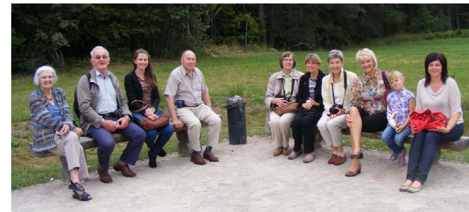
Šveices draugi kopā ar Sēmes un Zentenes pagastu pārvaldes darbiniekiem

Liels atbalsts ticis arī Sēmes skolai. Pēdējos trīs gadus skolēnu ēdināšanai