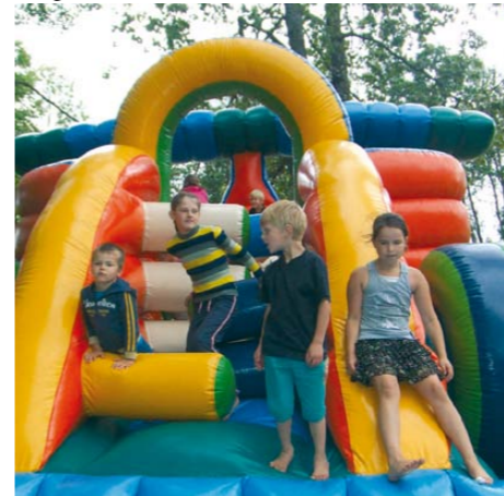
Pieprasītākā bērnu atrakcija Jaunsātu svētkos

Jaunsātos notika pagasta svētki trīs dienu garumā.