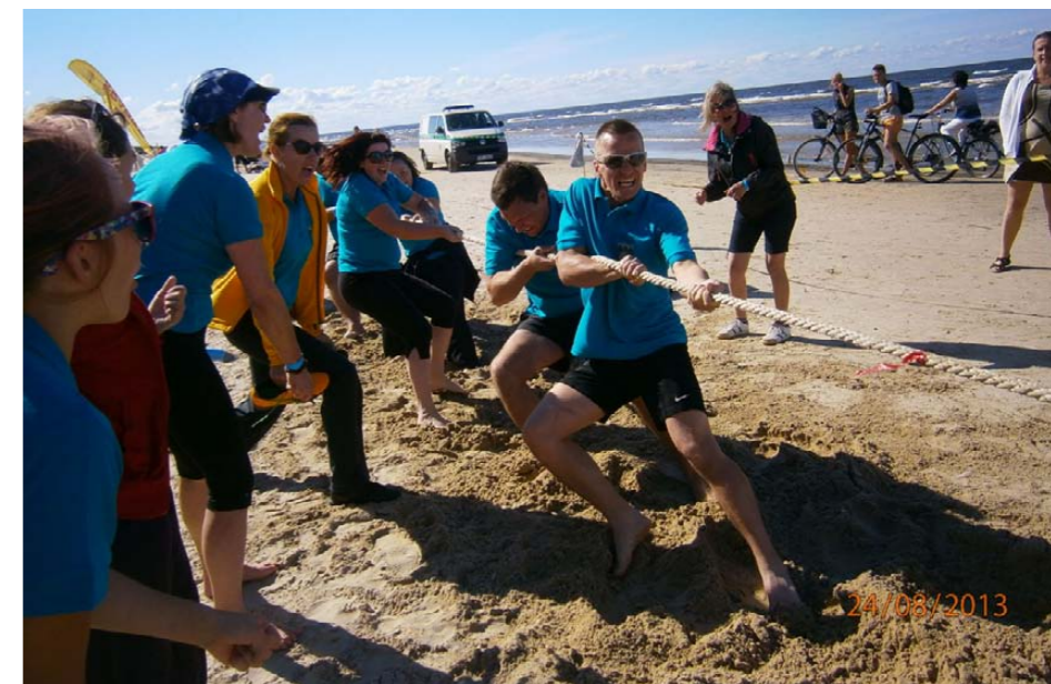
Tukuma novada Domes komanda sīvā cīņā virves vilkšanā

Augusta beigās Jūrmalā notika Latvijas pašvaldību darbinieku veselības, sporta un zināšanu diena Jūrmalā ar devīzi „Uz viļņa!”. Tukuma novadu šajā pasākumā pārstāvēja 13 Tukuma novada Domes administrācijas dalībnieki un viņu ģimenes locekļi. Visas aktivitātes notika jūras krastā Majoru pludmalē. Pavisam dalībnieki sacentās 23 sporta, mākslas un tūrisma izziņu disciplinās. Vissīvāk tukumnieki cīnījās virves vilkšanā, kur pirmo vietu ieguva Kokneses novads. Mūsu labākie sasniegumi un divas pirmās vietas šoreiz bija mākslu jomās. Tukumnieku veidotais smilšu vides objekts – lepns, ar novada karodziņiem greznojies, peldošais krokodils bija viens no košākajiem un lielākajiem. Visnotaļ veikli tukumnieki atrada smiltīs apslēpto mantu, kā arī uzdevumā „Lēnākais riteņbraucējs” bijām vieni no pirmajiem. Toties „Jūrnīeku mezglā” gan īsti neveicās. Sevi mierinājām ar domu, ka tomēr nesam novads, kas administratīvi atrodas