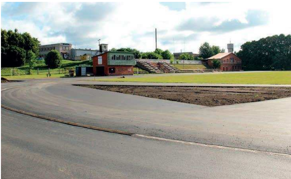
Tukuma Sporta un atpūtas kompleksa stadionā būvdarbi rit pilnā sparā

1.septembris vairs nav aiz kalniem, un jaunajam mācību gadam gatavojas ne tikai skolēni, bet arī izglītības iestādes. Lai veiksmīgi uzsāktu jauno mācību gadu un nodrošinātu kvalitatīvu izglītības procesu, Tukuma novada vispārējās izglītības un pirmsskolas izglītības iestādēs tiek veikti vērienīgi remontdarbi, kā arī citi uzlabojumi.