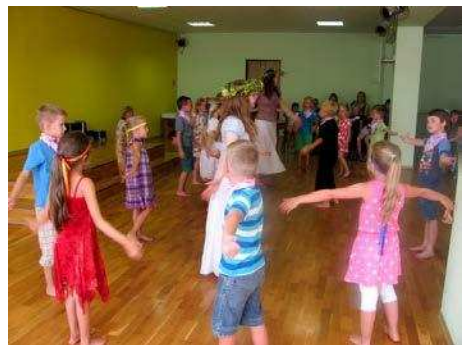
Irlavas svētkos deju nometnes „Ziļuks” dalībnieki

No 12. līdz 14. jūlijam notika 16. Irlavas svētki, kuru programmas ietvaros varēja baudīt dažādus pasākumus, atpūsties pēc katra vēlmēm.