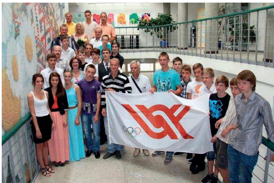
Par augstiem sasniegumiem tika sveikti Latvijas Jaunatnes olimpiādes dalībnieki

Lai nodrošinātu iedzīvotāju kustības drošību, uzsākta Talsu ielas ietves izbūve posmā no Pauzera ielas līdz Kurzemes ielai, izbūvējot ietvi vienā brauktuves pusē. Darbus veic SIA „Strabag”, kurš piedāvāja izdevīgākos samaksas noteikumus. Darbi tiek veikti par pašvaldības budžeta līdzek-