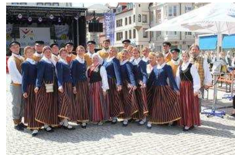
Deju kolektīvs „Solis” Eiropēdē

Tumes kultūras nama vidējās paaudzes deju kolektīvs „Solis” piedalījās pasākumā „Eiropēde 2013”, kurš norisinājās Vācijā Gothas pilsētā no 16. līdz 23. jūlijam.