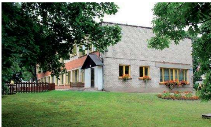
Pamatskolas ēka Raudas ielā 3

2013.gada 29.maijā Rīgā tika noslēgta vienošanās Nr.3DP/3.1.4.3.0/13/IPIA/