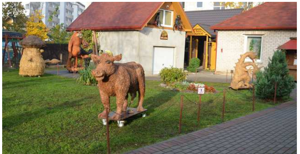
Muzeja pagalmā apmeklētājus priecē lielās skulptūras