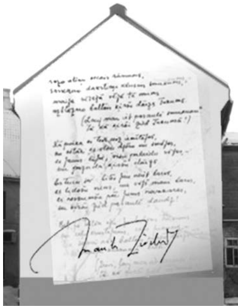
Katrīnas laukumā uz ēkas sienas tiks iemūžināts Imanta Ziedoņa dzejolis „Tukums”

Lai arī dzejnieks Imants Ziedonis vairs nav starp mums, mēs viņu atceramies un pieminam ne tikai savās sirdīs, bet arī darbos. 2010. gada pavasarī Tukumā uzsākām jaunu tradīciju - notika publiskā talka, kuras laikā veidojām Ziedoņa ķiršu dārzu Mālkalnā. Šo tradīciju turpināsim. 1. maijā plkst. 10.00 ar cimdiem un lāpstām rokās jau trešo gadu pēc kārtas pulcēsimies, lai stādītu ķiršus. Piedalīties aicināti Imanta Ziedoņa domubiedri un tuvinieki, Tukuma literātu apvienības biedri. Ieradīsies arī fonda „Viegli” pārstāvji, kas īsteno fonda patronam – dzejniekam Imantam Ziedonim tuvu misiju: „Latvija ir brīnumskaista zeme, bet skaistajam jāpalīdz parādīties”.