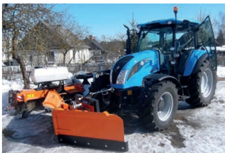
Liels palīgs būs nesen iegādātais traktors LANDINI POWERMONDIAL 115

Sākam veidot pašvaldības ceļu uzturēšanas iecirkni. Uzņēmuma iecere ir katrā pagastu pārvaldes iecirknī iegādāties traktoru ar pietiekošu jaudu un sniega lāpstu, kurš ziemā varētu palīdzēt ātrāk attīrīt aizputinātos ceļus, bet vasarā veikt ceļmalu apļaušanu, ceļu greiderēšanu un grantēto ceļu seguma atjaunošanu. Iesākums šiem plāniem jau ir – šāds traktors iegādāts Sēmes iecirknī.