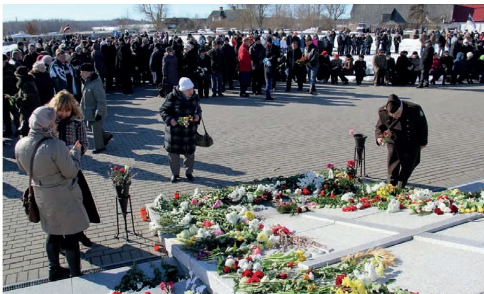
Leģionāru piemiņas diena 16. martā Lestenes Brāļu kapos pulcēja vairāk nekā 500 interesentu.

27. martā parakstīts līgums ar SIA „Kurzemes Ainava” un SIA „Jūrmalas ATU” par sadzīves atkritumu apsaimniekošanu Talsu, Dundagas, Engures, Jaunpils, Kandavas, Mērsraga, Rojas un Tukuma novados. Ļoti svarīgi, lai līdz šī