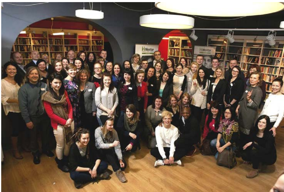
Mentoru atklāšanas pasākumā

Mentorprogramma ilgst vienu gadu, mentoram un jauniešim tiekoties divas reizes mēnesī. Reizi divos mēnešos tiek rīkotas regulāras atbalsta grupas tikšanās ar parējiem mentoriem. Programmas ietvaros notiek arī kopīgi pasākumi mentoriem un jauniešiem, kā arī dažādas izglītojošas nodarbības pašiem jauniešiem (karjeras veidošana, budžeta plānošana, attiecību veidošana, atkarības un citas tēmas). Mūsu atbalstītāji sniedz iespēju programmā iesaistītajiem dalībniekiem apmeklēt teātri, hokeja spēles un izstādes.