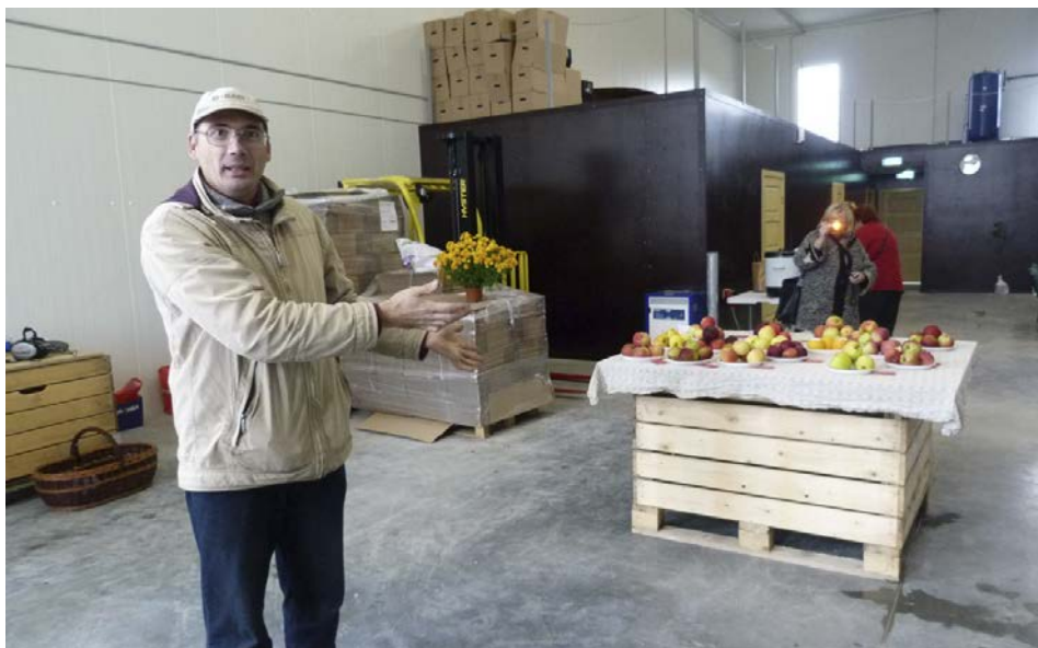
Jaunās augļu noliktavas atklāšana

Pārvaldē notikušas gan Džūkstes pagasta, gan Slampes pagasta konsultatīvās padomes.