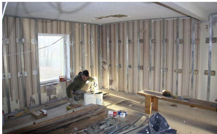
Leģionāru piemiņas istaba remonta laikā

Līdz ar teritorijas labiekārtošanas darbiem, tiek veikta arī Leģionāru piemiņas istabas renovācija. Esošā telpa tiks pilnībā izremontēta, un tajā tiks ievilkta apkure. Blakus esošajai telpai tiks izveidota jauna telpa, kura līdz šim netika apgūta. Šī telpa paredzēta mazāku pasākumu norisei, kā arī Svētdienas skolas nodarbībām.