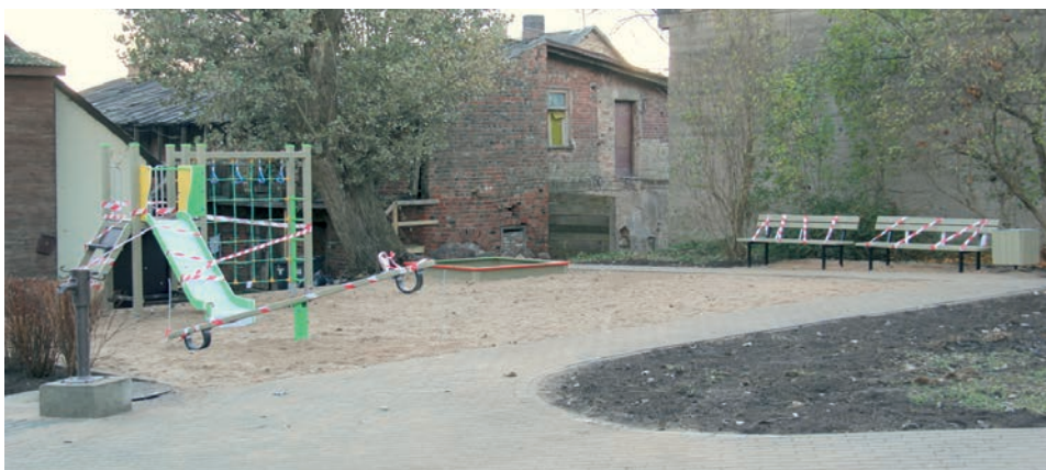
Skvērs pie Dārza un Talsu ielas krustojuma

Turpinās Pauzera pļavu mākslīgā seguma futbola laukuma labiekārtošanas projekta darbi. Pabeigta komunikāciju – elektroapgādes, ūdensvada un kanalizācijas izbūve, izbūvēta lietusūdens novadišanas