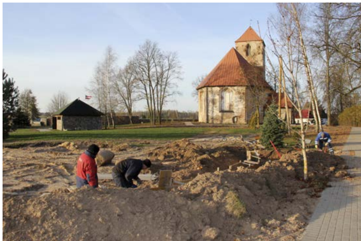
Strādnieki veido ugunsкура vietu

Projekts par II Pasaules karā kritušo latviešu leģiona karavīru piemiņas memoriāla piegulošās teritorijas labiekārtošanu ar Tukuma novada Domes finansējumu tika izstrādāts jau 2011.-2012. gadā. Šogad projekta īstenošanu savā pārziņā pārņēma fonds „Daugavas Vanagu Centrālās Valdes pārstāvniecība Latvijā”, kas ne vien organizē un pārrauga darbus, bet arī palīdzējis ar projekta pamatfinansējumu. Projekta kopējās izmaksas ir 50247,00 euro, no tām 45223,00 euro ir Daugavas Vanagu Centrālās Valdes finansējums, 5024,00 euro – Tukuma novada Domes līdzfinansējums.