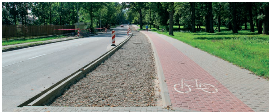
Lielajā ielā tiek izbūvēts bruģa segums

Par naudas līdzekļiem. Līdz 2014.gada 26.augustam IIN (iedzīvotāju ienākuma nodoklis) gada plāns izpildīts par 67,28% (+0,61% no plānotā). Tas ļauj prognozēt, ka IIN plānotā izpilde būs lielāka par 2,0%,