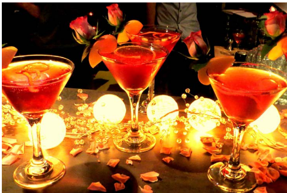
Tukuma Rožu kokteilis

Aicinām ikvienu ēdināšanas uzņēmumu un pilsētas iedzīvotāju griezties pie