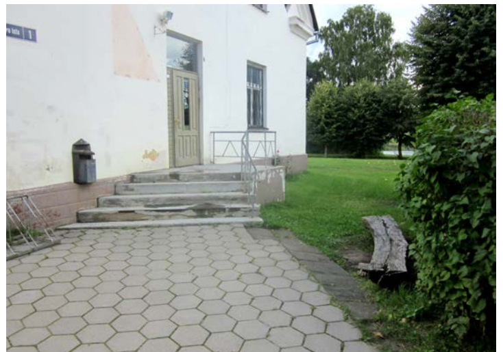
Kopienas centra teritorija pirms darbu uzsākšanas

Sēmes pagasta kopienas centra teritorija tiek labiekārtota Eiropas Zivsaimniecības fonda pasākuma „Teritoriju attīstības stratēģiju īstenošana” projekta „Sēmes pagasta kopienas centra teritorijas labiekārtošana” Nr.13-08-ZL04-Z401101-000001 ietvaros.