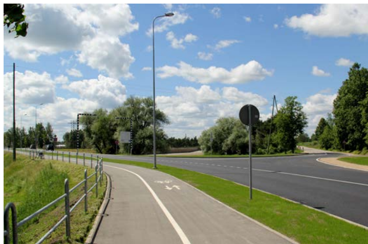
Zemītes ielas un Stacijas ielas posmi pēc rekonstrukcijas

Rekonstrukcijas darbus veica „Strabag” SIA, 2.kārtas būvuzraudzību nodrošināja