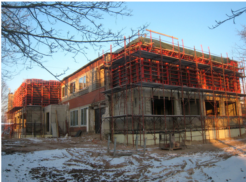
Objektā būvdarbi rit pilnā sparā.

Būvdarbu vadītājs atzīst, ka objektā darbu vēl ir ļoti daudz – jāveic iekšējā un ārējā apdare, labiekārtošana un ārējo tīklu izbūve. Tomēr, ja būs pateicīgi laika apstākļi un