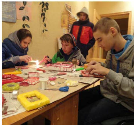
Sēmes jauniešu centrā visas nedēļas garumā notika dažādi svečošanās pasākumi.

No 27. līdz 31.janvārim Sēmē un Zentenē bija Svečošanās nedēļa. Tai par godu notika dažāda rakstura un apjoma pasākumi – viss par un ap svečēm.