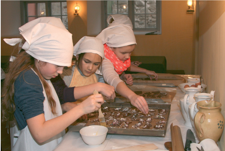
Ziemassvētku aktivitātes Durbes pilī.

Tuvojoties gada skaistākajiem svētkiem, aicinām ikvienu interesentu piedalīties radošajās darbnīcās, lai uzburtu svētku noskaņu un pavadītu jaukus mirkļus kopā ar saviem mīļajiem.