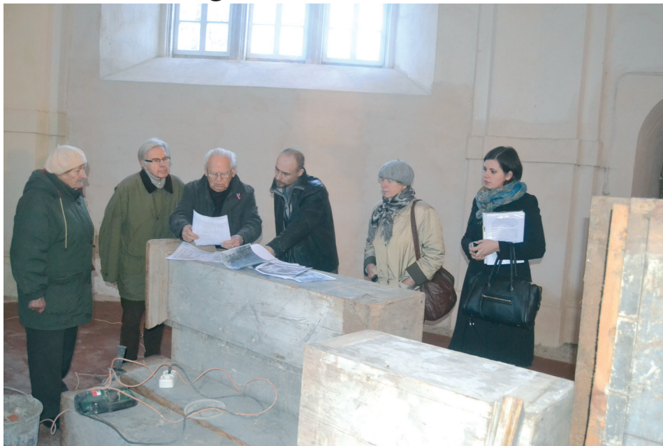
Ienesta daļa no greznā Lestenes baznīcas altāra.

Atvestie altāra fragmenti tiks restaurēti un, iespējams, līdz Ziemassvētkiem altāra pirmo daļu varēs salikt kopā. Kopumā greznais altāris ir turpat 10 m augsta būve, kuru veido Bībeles tēlu skulptūras, ziedu un lapu vijumi. Pārējā baznīcas iekārta joprojām atrodas Rundāles pils muzejā, un līdz ar baznīcas atjaunošanu pakāpeniski tiks nogādāta atpakaļ tās mājvietā – Lestenes baznīcā. Lai šo mērķi īstenotu, 2012.