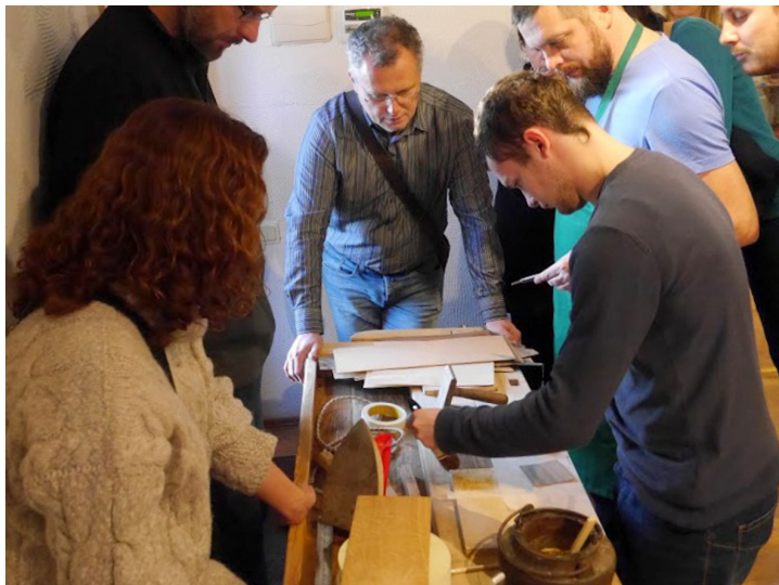
Meistarklašu dalībnieki izmēģina virsmas finierēšanu. Foto no „Senlaicīgo koka mēbeļu restaurācijas meistarklasēm” šā gada novembrī Tukumā.