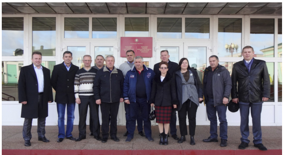
Tukuma novada Domes delegācija kopā ar Koreļiču rajona izpilddomtējas priekšsēdētāju un viņa vietniekiem, delegācijām no Maņkovkas Ukrainā un Krasnogorskas Krievijā