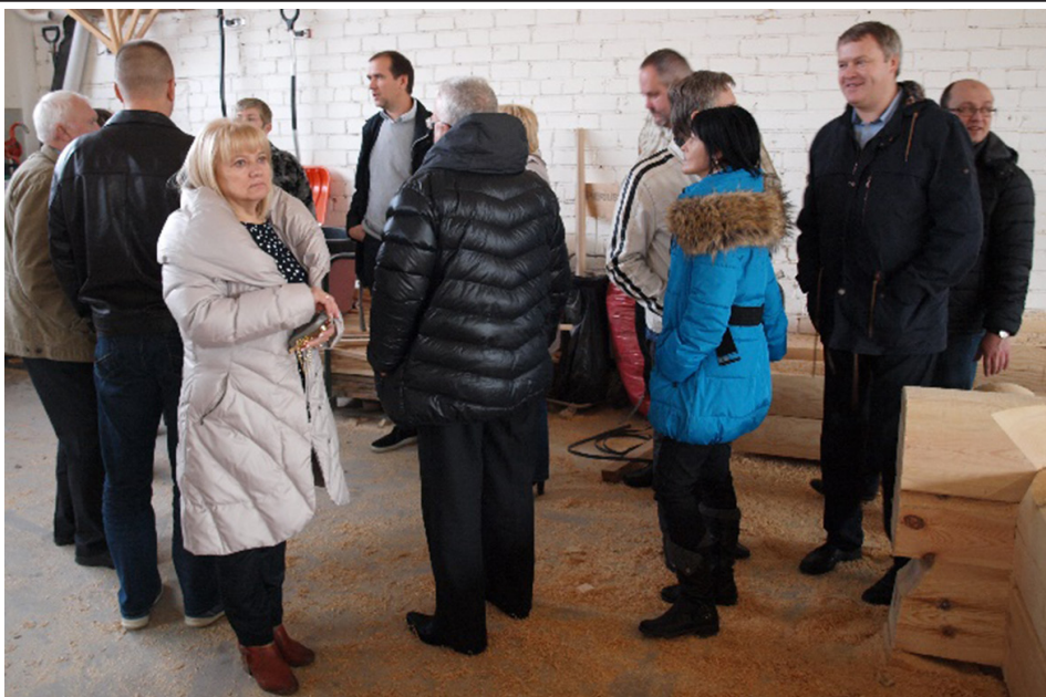
Viesošanās uzņemumā "LHM group"

Plūņģes rajona pašvaldība ir nozīmīgs Tukuma novada partneris uzņēmējdarbi-