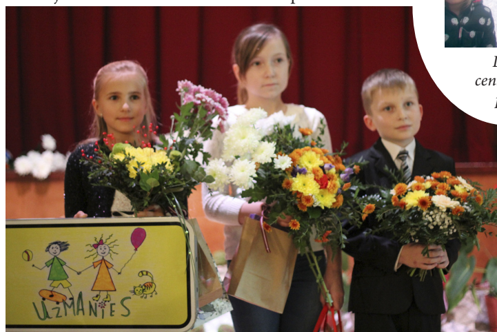
Konkursa pirmo trīs vietu ieguvēji

jā, kur uz ceļa zīmēm „Uzmanību, bērni!” uzstādīti uzmanību piesaistoši papildielementi – zīmējumu konkursa uzvarētāja radītais attēls, kas iestrādāts atbilstošā materiālā.