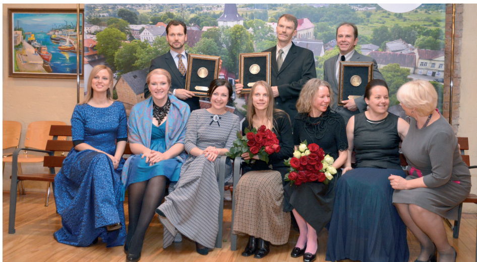
Tukuma TIC komanda ar balvu „Lielais Jēkabs 2015” ieguvējiem – Tukuma novada un Jaunpils novada uzņēmējiem

Lielā Jēkaba balvu nominācijā „Dižais Kurzemes meistartiķis mazajiem 2015” ieguva arī kaimiņu – Jaunpils novada radošā darbnīca „7 balles”. Pirmais iespaids par šo darbnīcu – krāsaini un daudzveidīgi!