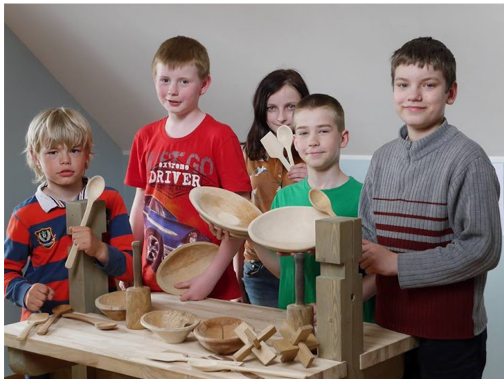
Radošo darbnīcu dalībnieki Tukuma Jauniešu centrā atrāda savu veikumu. Foto no radošajām kokamatniecības darbnīcām Tukuma novada Multifunkcionālajā jaunatnes iniciatīvu centrā 2014./2015.mācību gadā.

Šā gada 21. un 28.novembrī tepat Tukumā, Rīgas ielā 14, notika meistarklašu cikls „Senlaicīgo koka mēbeļu restaurācija”, kuru organizēja biedrība „Koka dizaina centrs” sadarbībā ar kokamatniecības un restaurācijas profesionāļiem.