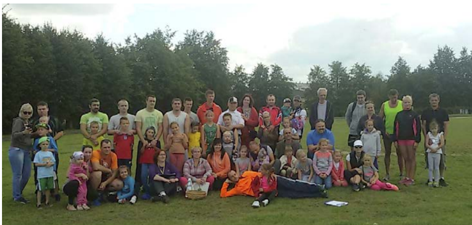
Tukuma 2.vidusskolas skolēni kopā ar vecākiem sporta dienā

11.septembra rīts atausa tik saulains, ka ikviens 8.-12.klases skolēns bija gatavs doties uz futbola laukumu Pauzera plavā, lai kopā ar savu klasi piedalītos komandu sa-