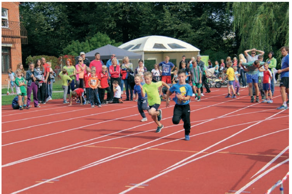
Tukuma Sporta un veselības svētki guva lielu atsaucību dalībnieku vidū

sā Lauktechnikā norisinājās pirmie Tukuma Sporta un Veselības svētki, kas guva lielu atsaucību dalībnieku vidū un pulcēja ap 2000 apmeklētāju. Vienlaikus ar Veselības ministrijas atbalstu tika atklāts Veselības maršruts. Tukums ir izvēlēts kā viena no piecām pašvaldībām, kas ir iestājusies veselīgo pašvaldību tīklā 2014.gadā.