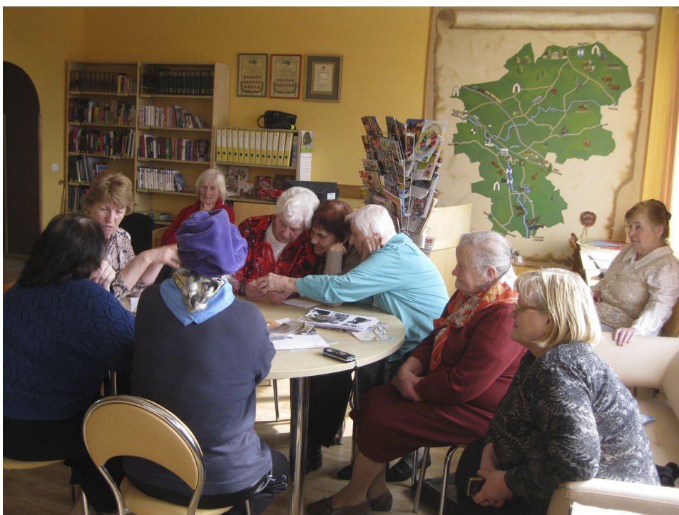
Tikšanās ar Pūres siltumnīcu bijušajām darbiniecēm.

Otrs notikums, kas Pūres vārdu 20.gadsimta 30-tajos gados padarīja populāru, ir siltumnīcu celtniecība. Pūrē pirmās Holandes tipa siltumnīcas tika uzbūvētas 1929.gadā. Šīs vienkāršās „blokmājas” Latvijā bija jaunums, pēc to parauga tās tika celtas Rīgā, Jelgavā u.c. Stikla mājās tika audzēti ne tikai gurķi, tomāti, salāti, sīpolloki, spināti, bet arī vīnogas, citroni, ženšeņš, rozes