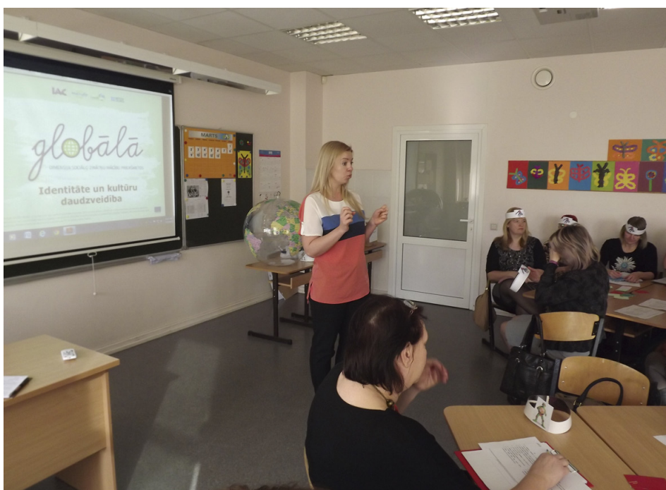
Novada pedagogu metodiskā diena 18.martā.

Projektā piedalījās 21 Latvijas skola, tostarp arī Tukuma 2.vidusskola, kura iedzīvina globālās izglītības tēmas mācību priekšmetos. Tādējādi tiek paplašināts skolēnu redzesloks un zināšanas par pasaulē