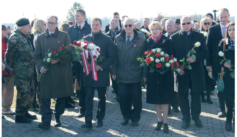
Piemiņas pasākums Lestenes Brāļu kapos

Turpinās tikšanās ar potenciālajiem investoriem par jaunu ražošanas objektu darbības uzsākšanu vai izbūvi. Visu tikšanās laikā ir izkristalizējušās divas pamatproblēmas – mājokļu un kvalificēta