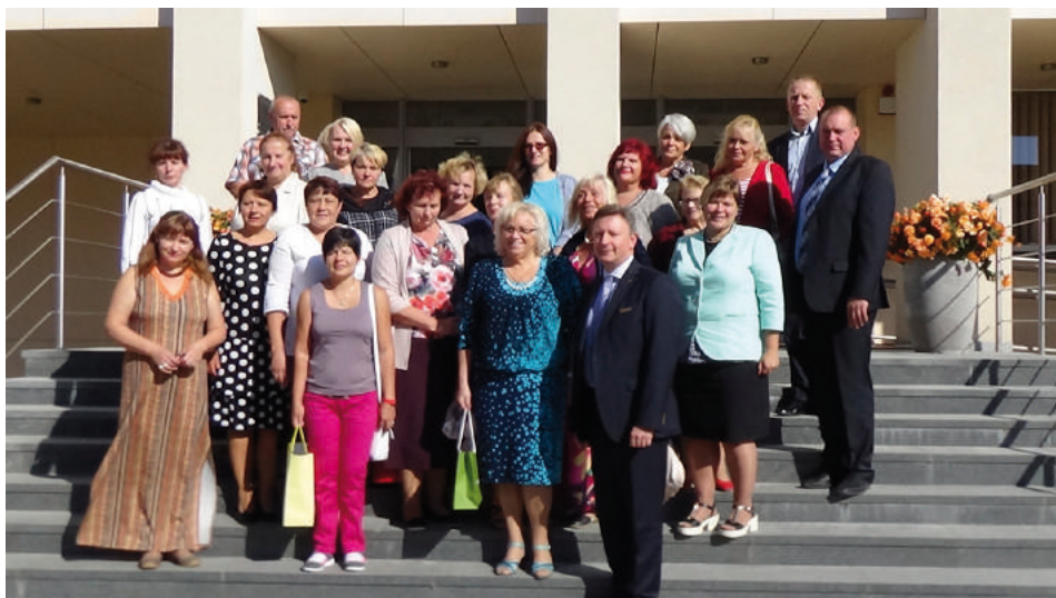
Tukuma NVOA biedrorganizāciju pārstāvju tikšanās ar Plūnģes pašvaldības vadību un NVO pārstāvjiem

Projekta mērķis ir attīstīt Tukuma NVOA darbu interešu aizstāvībā un aktivizēt darbības atpazīstamību vietējā sabiedrībā. Īstenojot projektu, tiek sekmēta Tukuma NVOA biedru sistemātiska līdzdalība lēmumu pieņemšanā, interešu aizstāvībā, un sabiedrībai sociālajos tīklos un Tukuma