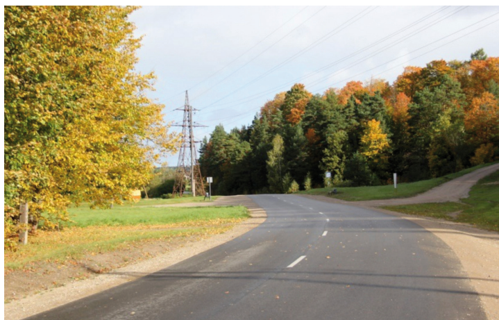
Tirgus iela pēc rekonstrukcijas

Viena no pašvaldības funkcijām ir gādāt par savas administratīvās teritorijas labiekārtošanu, kurā ietilpst ielu, ceļu un laukumu būvniecība, rekonstruēšana un uzturēšana, kā arī ielu, laukumu un citu publiskajai lietošanai paredzēto teritoriju apgaismošana utt.