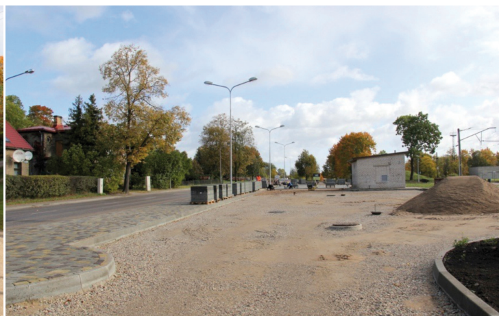
Stāvlaukuma izbūve dzelzceļa stacijas "Tukums 1" teritorijā

Viena no pašvaldības funkcijām ir gādāt par savas administratīvās teritorijas labiekārtošanu, kurā ietilpst ielu, ceļu un laukumu būvniecība, rekonstruēšana un uzturēšana, kā arī ielu, laukumu un citu publiskajai lietošanai paredzēto teritoriju apgaismošana utt.