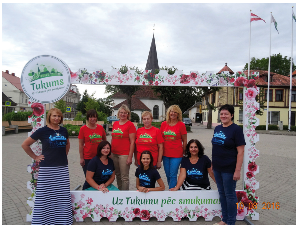
Tukuma bāriņtiesas pašreizējais kolektīvs

- Šobrīd bāriņtiesā strādā deviņi cilvēki - bāriņtiesas priekšsēdētājs, četri vietnieki, divi bāriņtiesas locekļi, kuri strādā pamat-