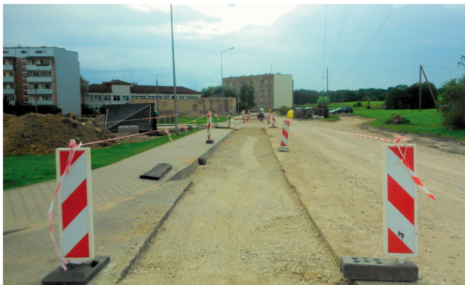
Smilšu iela rekonstrukcijas darbu laikā

tiks paaugstināta energoefektivitāte un samazināti siltumenerģijas zudumi. Gadam noslēdzoties, SIA "Tukuma siltums" izvērtēs siltumenerģijas izmaksas un nākamgad, iespējams, tiks pārskatīts siltuma tarifs.