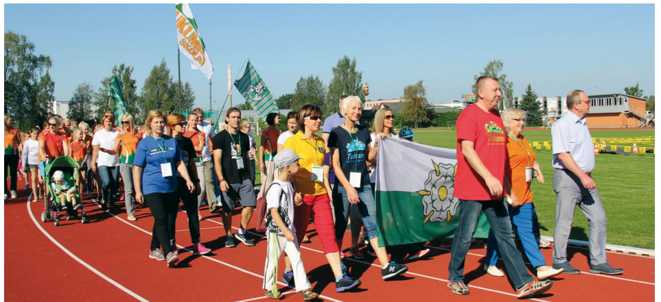
Parāde Tukuma Sporta un Veselības svētkos

7. septembrī noritēja kārtējā bijušā Tukuma rajona četru pašvaldību (Tukums, Kandava, Engure, Jaunpils) vadītāju tikšanās. Tika izskatīti jautājumi par aktualitātēm veselības aprūpes reformas jomā un kārtējiem SIA "Tukuma slimnīca" darbiem. Šajā sakarā tika akcentēta Tukuma pašvaldības pārstāvja piedalīšanās Veselības ministrijas rīkotajā sanāksmē 9. septembrī.