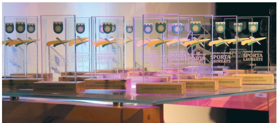
Tukuma novada Sporta laureātā tika apbalvoti sportisti 23 nominācijās

18.februārī noritēja tikšanās ar Latvijas tirdzniecības un rūpniecības kameras pārstāvjiem ar mērķi aktivizēt un dažādot sadarbības formas. Kā viena no iespējām tiek vērtēta piedalīšanās Zemgales reģiona uzņēmēju izstādēs.