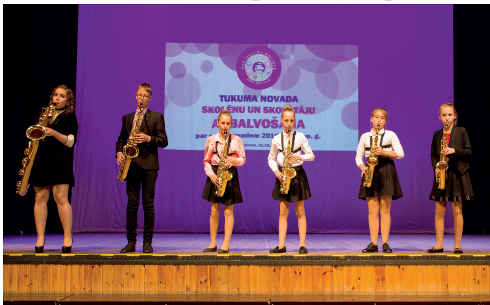
Muzikālu priekšnesumu sniedza Tukuma Mūzikas skolas saksofonisti