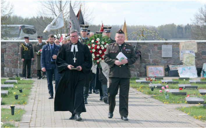
Otrā pasaules kara upuru piemiņai veltīts pasākums Lestenes Brāļu kapos