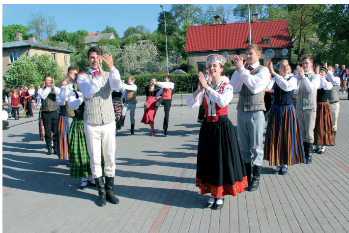
28.maijā Tukuma dzelzceļa stacijā "Tukums I" tika sagaidīts Latvijas ekspresis simtgadei