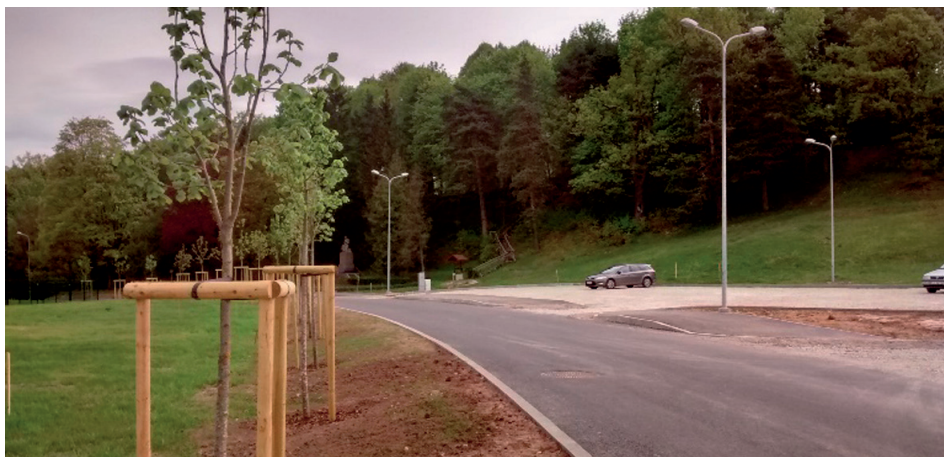
Melnezera iela būvdarbu laikā

Plānotās projekta darbības ir vērstas uz uzņēmējdarbības veikšanai nepieciešamo, bet tajā pašā laikā degradēto teritoriju atjaunošanu, kurā, attīstot ceļu satiksmi