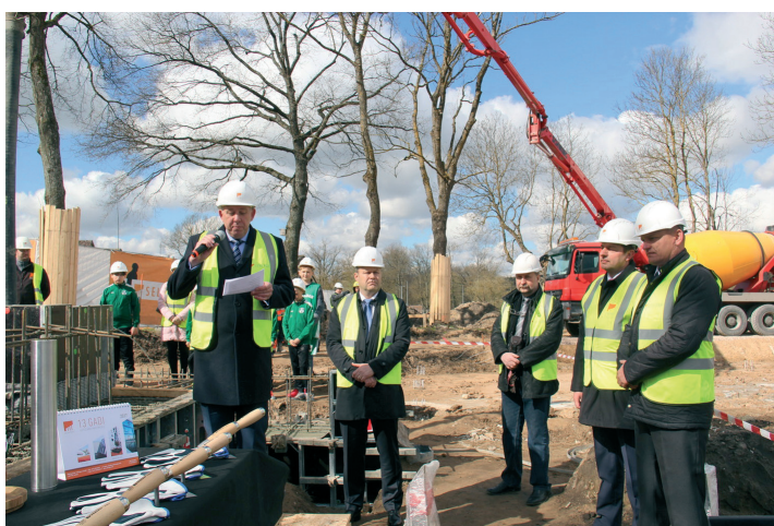
Kapsulas ar vēstījumu nākamajām paaudzēm iemūrēšana Tukuma 3.pamatskolas sporta zāles pamatos