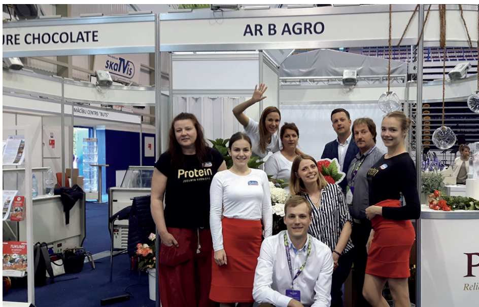
Slampes pagasta a/c “Jelgava–Tukums” – Kalnāji–Minsteri

SIA “Puratos Latvia” izstādes ietvaros savus apmeklētājus iepazīstināja ar kvalitatīvām izejvielām maizniekiem, konditoriem un šokolādes meistariem. AS “Tukuma piens” stendā varēja ne tikai apskatīt, bet arī nobaudīt pašus jaunākos “Baltais” produktus – Baltais Protein, pienu ar dažādām garšām, kefīru ar garšām, dzeramos grieķu jogurtus, saldā krējuma jogurtus un citus gardumus. Mirkli garšas prieka aicināja izbaudīt SIA “Pure Chocolate”, piedāvājot šokolādes trifeles, kas ražotas no beļģu šokolādes un dabīgiem pildījumiem. SIA “TU FOOD” ir jaunums arī pašiem tukumniekiem. Izstādē uzņēmums iepazīstināja ar sevi un prezentēja Tukumā ražotu saldējumu. Savukārt papildu krāšņumu Tukuma stendam ar brīnišķīgām rozēm un citiem ziediem piešķīra SIA “Ar B Agro”, atgādinot, ka uz Tukumu ir jābrauc pēc smukuma!