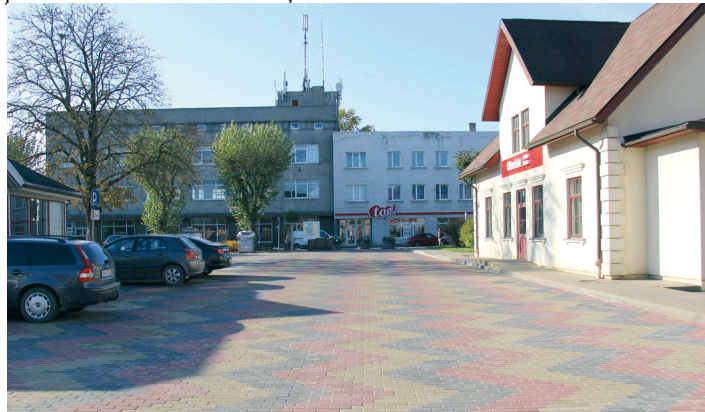
Stāvlaukums pie bankas "Citadele"

Uzlabojot pilsētas vidi un padarot to pieejamāku gan vietējiem iedzīvotājiem, gan viesiem, sakārtoti vairāki pilsētas ielu posmi (Tirgus, Stadiona, Baznīcas, Eksporta, Rūpniecības, Smārdes, Zaļās, Pārupes, Smilšu ielas) un izbūvētas ietves (Talsu, Lielajā, Jāņa, Celnieku, Spartaka, Pārupes, Dārzniecības ielās). Tika pabeigta stāvlaukuma izbūve dzelzceļa stacijas "Tukums 1" teritorijā, kur ierīkotas 50 automašīnu stāvvietas, un pēc iedzīvotāju un uzņēmēju lūguma tika paplašināts stāvlaukums pie bankas "Citadele"; šajā pavasarī laukums tiks marķēts.