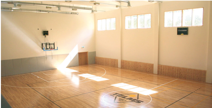
Tukuma Sporta skolas jaunā zāle

Par pašvaldības budžeta līdzekļiem par modernu sporta zāli ir pārbūvēta Tukuma Sporta skolas aktu zāle, radot audzēkņiem iespēju trenēties piemērotos apstākļos. Nākamie soļi sporta būvju attīstībā ir sporta kompleksa izbūve pie Tukuma 3. pamatskolas un vieglatlētikas manēžas izbūve pie Tukuma Sporta skolas. Aizvadītā gada nogalē tika parakstīts līgums ar SIA "Selva būve" par Tukuma 3. pamatskolas sporta zāles un stadiona būvniecību, un jau šobrīd ir uzsākti objekta būvdarbi. Objektu paredzēts izbūvēt līdz 2018. gada februārim.