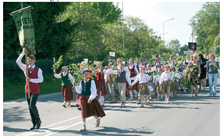
Gājiens bērnu un jauniešu dziesmu un deju pasākumā

Pirmo reizi Tukumā tika organizēts Tukuma, Engures un Jaunpils novadu bērnu un jauniešu dziesmu un deju pasākums ar svētku dalībnieku gājienu.