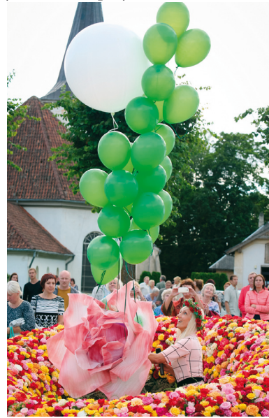
Rožu svētki 2016

2015.gadā tika uzsākts un 2016.gadā turpināts darbs pie Kurzemes ielas rekonstrukcijas tehniskā projekta izstrādes. Par projektā paredzētajām iecerēm tika informēti arī Kurzemes ielas ēku īpašnieki. 2016.gadā tika turpināta arī Brīvības laukuma rekonstrukcijas tehniskā projekta izstrāde.