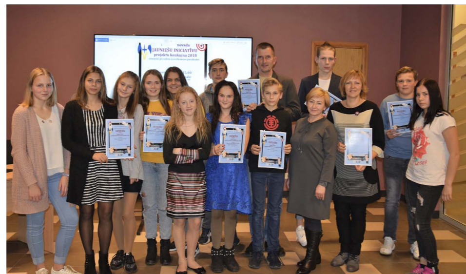
“Tukuma novada jauniešu iniciatīvu projektu konkursa 2018” īstenoto projektu autori

Galvenokārt projektu idejas un iniciatī-