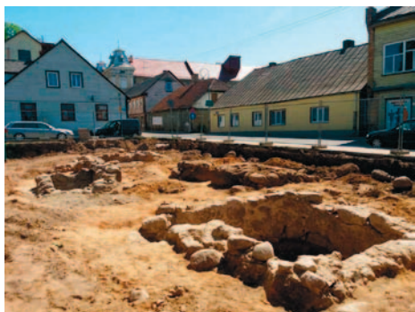
Arheoloģisko izrakumu gaitā pie Lielās ielas un Jaunās ielas krustojuma atsegti trīs nelieli pagrabi, kas ir vecāki par 19. gadsimtu

Turpinās Tukuma 3. pamatskolas sporta halles būvdarbi. Pabeigta stadiona skrejceļa virskārtas iekļāšana un krāsošana, ieklāts arī futbola laukuma mākslīgā zāliena segums. Turpinās halles un palīgtelpu iekšdarbi, apdares darbi un ēkas iekšējo inženierkomunikāciju izbūve. Turpinās teritorijas labiekārtošana. Šis projekts tiek finansēts no pašvaldības budžeta līdzekļiem ar valsts budžeta līdzfinansējumu.