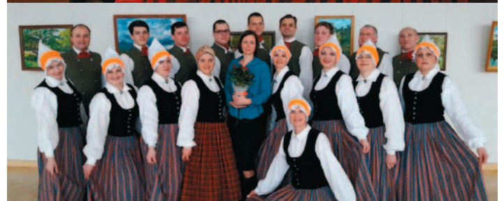
Jauniešu tautas deju kolektīvs "Pūrenieks" un vidējās paaudzes tautas deju kolektīvs "Pūre"

saucēju un saliedētāju" (teksts no Dziesmu un Deju svētku avīzes).