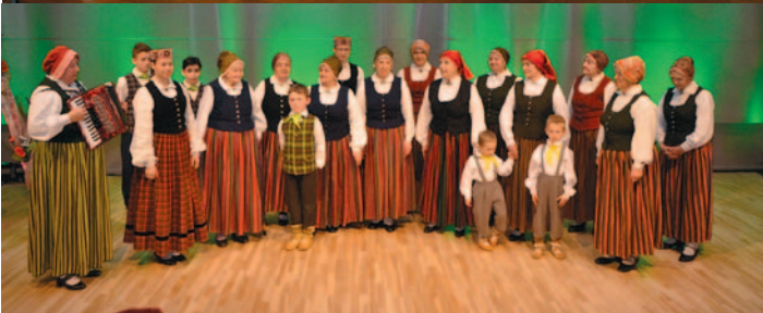
Sieviešu koris "Abava" un folkloras kopa "Pūrlāde"

"Dziesmu un deju svētku tradīcija Latvijā ir nepārtraukts radošā darba process, kurā sadarbojas tautas mākslas kolektīvi un tradicionālās kultūras lietpratēji. Vispārējie latviešu Dziesmu un deju svētki gadu gaitā ir kļuvuši par Latvijas nacionālās kultūras un nācijas identitātes svinībām. Šo svētku laikā gan katrs Latvijas novads, gan katrs mākslas žanrs demonstrē savus sasniegumus, dodot iespēju mūsu iedzīvotājiem un viesiem iepazīt un baudīt Latvijas kultūras daudzveidīgās izpausmes. Pēc savas misijas Dziesmu un deju svētki ir kļuvuši par sava veida Latvijas nācijas svētkoļojumu, kurā dodas lieli un mazi no visām Latvijas malām, kā arī no ārvalstīm. Svētki ir kļuvuši par spēcīgu mūsu tautas kopā