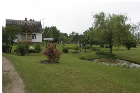
"Vizbuli" – viena no sakoptākajām lauku sētām Pūres pagastā.