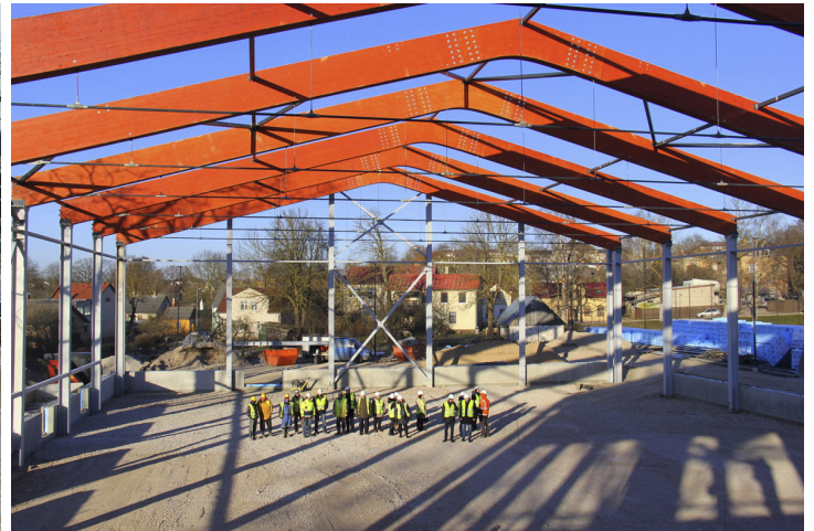
Atzīmējot Spāru svētkus jaunajai sporta hallei pie Tukuma 3.pamatskolas

Pārskata periodā svarīgākie notikumi sabiedriski politiskajā jomā: