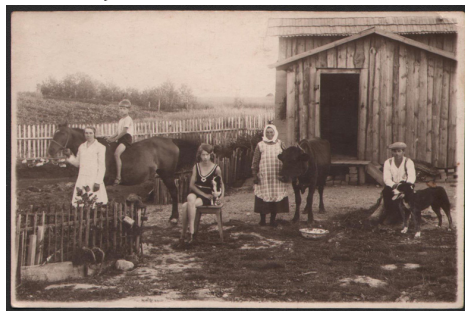
Attēlā māju "Vizbuli" iemītnieki ar kaimiņu bērniem 20. gadsimta 30. gados.