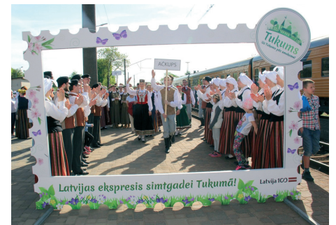
Sagaidot Latvijas ekspresi simtgadei

Jūlijā trīs lustīgu dienu garumā norisinājās Pilsētas svētki, kuru tēma bija "Precību spēles Tukumā", kas ietvēra plašu pasākumu klāstu dažādām gaumēm. Svētki bija kupli apmeklēti un izdevušies.