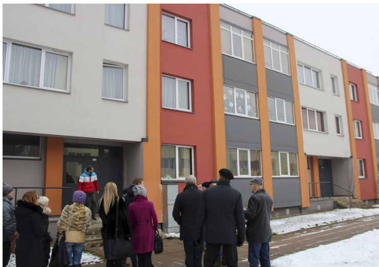
Atjaunotās ēkas Stacijas ielā 28 un Kaijas ielā 6, Siguldā