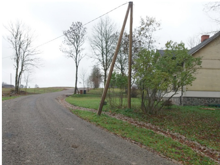
Sāti-Karotītes pretputekļu segums

Pārbūves darbi ir veikti Eiropas Lauksaimniecības fonda lauku attīstības pasākuma "Pamatpakalpojumi un ciematu atjaunošana lauku apvidos" projekta "Pašvaldības autoceļu pārbūve Tukuma novada Irlavas un Lestenes pagastā" Nr. 17-08-A00702-000035 ietvaros. Darbus veica SIA "Strabag", būvuzraugs – SIA "Būves birojs" un autoruzraugs – "Osāhning Reaalpro-