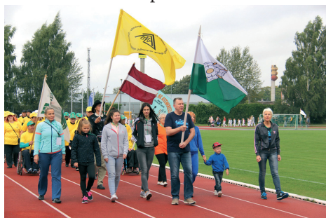
Sporta un Veselības svētku atklāšanas parāde

dzīvesveidam, septembrī jau trešo reizi tika organizēti Tukuma Sporta un Veselības svētki ar dažādām sporta aktivitātēm.