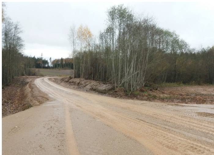
Cīruļi-Bērziņi ceļa posms