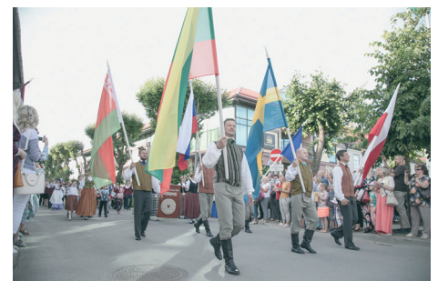
Pilsētas svētku gājieni

Jūlijā trīs lustīgu dienu garumā norisinājās Pilsētas svētki, kuru tēma bija "Precību spēles Tukumā", kas ietvēra plašu pasākumu klāstu dažādām gaumēm. Svētki bija kupli apmeklēti un izdevušies.