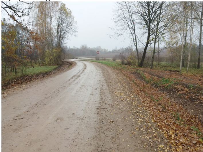
Sāti-Karotītes ceļa posms

Projekta ietvaros pārbūvēja izvēlētos pašvaldības autoceļa posmus, nodrošinot nepieciešamo autoceļa nestspēju, pastiprinot tā segu ar jaunu grants šķembu maisījuma seguma kārtu, sakārtojot ūdens atvaidīšanas sistēmu (jaunu caurteku, grāvju izbūvi). Irlavas pagasta autoceļa Sāti-Karotītes vienā posmā tika veikta virsmas apstrāde ar bitumena emulsijas maisījumu, izveidojot pretputekļu klājumu. Rezultātā tika samazināts putekļu daudzums. Ceļa Sāti-Karotītes posmā tika izbūvēts asfaltbetona seguma posms, lai pieslēgtos pie valsts autoceļa. Neattiecināmās izmaksas par asfaltbetona segumu segtas no pašvaldības budžeta li-