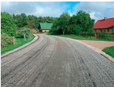
Pārbūvētais autoceļa posms Krūmiņi-Atpūtas ar pretputeķļu segumu

Aizvadītajā gadā pašvaldība uzsāka īstenot arī projektu "Pašvaldības autoceļu pārbūve Tukuma novadā", kas paredz pārbūvēt pašvaldības autoceļus 43,7 km garumā visā novadā. Pērn tika pārbūvēti šādi autoceļu posmi: "Jelgava-Tukums"-Kalnāji-Minsteri Slampes pagastā, Baltiņi-Grauzde un Jaunzemji-Grauzde Džūkstes pagastā, Krūmiņi-Atpūtas un Rotkaļi-Vecmokas Tumes pagastā, Beitiņi-Liepsalas Pūres pagastā, Sāti-Karotītes Irlavas pagastā, Cīruļi-Bērziņi Lestenes pagastā. Būvdarbi uzsākti un 2018.gadā plānots pārbūvēt šādus autoceļu posmus: Kaive-Vilksalas, Sildārziņi-Vilksalas, Paegli-Vilksalas un Sēme-Ziediņi Sēmes pagastā, Apšukrogs-Strēli Pūres pagastā, Šūļas-Bērznieki-Bajāri Jaunsātu pagastā un Spirgus-Praviņu ceļš Degoles pagastā.