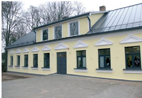
Aptiekas māja 3 Džūkstē

No pašvaldības budžeta līdzekļiem 2017.gadā tika atjaunota ēka "Aptiekas māja" 3 Džūkstē, kurā ar Lauku atbalsta dienesta līdzfinansējumu ierīkots kopienas centrs ar nosaukumu "TeV". Šis ir jau ceturtais kopienas centrs Tukuma novadā, kurš izveidots ar mērķi uzlabot iedzīvotāju dzīves kvalitāti un mudināt iedzīvotājus iesaistīties sabiedriskajās aktivitātēs. 2018.gadā šajā ēkā paredzēts ierīkot arī aptiekas punktu, fizioterapeita kabinetu un iekārtot telpas sociālajiem darbiniekiem.