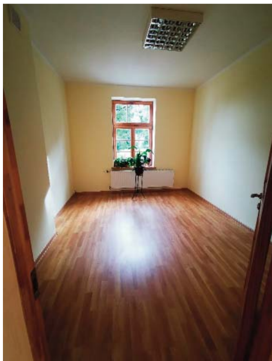
Jaunā telpa pirms skatuves.

324,45 EUR, no kurām publiskais finansējums – 18 292,00 EUR.