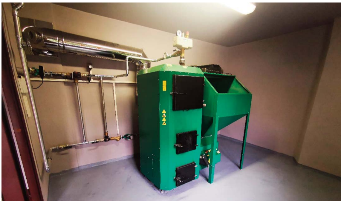
Jaunā apkures sistēmas telpa.

Atbalsta Zemkopības ministrija un Lauku atbalsta dienests