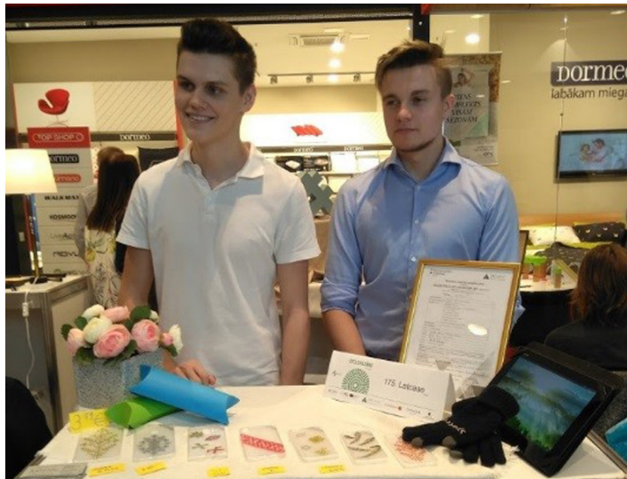
Tukuma Raiņa ģimnāzijas jaunie uzņēmēji piedāvā mobilo telefonu aksesuārus ar latviešu rakstu zīmēm.

2019.gada 9.martā JA Latvija tirdzniecības centrā "Domina Shopping" Rīgā rīkoja skolēnu mācību uzņēmumu Latvijas mēroga pasākumu "CITS BAZĀRS pavasarī 2019", kurā piedalījās arī Tukuma Raiņa ģimnāzijas, Tukuma 2.vidusskolas un Irlavas pamatskolas skolēnu mācību uzņēmumi. Tukuma Raiņa ģimnāzijas skolēnu mācību uzņēmums pasākuma apmeklētājiem piedāvāja mobilo telefonu aksesuārus ar latviešu rakstu zīmēm.