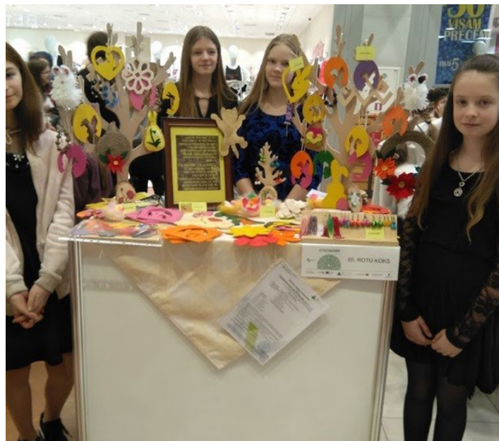
Irlavas pamatskolas skolēnu mācību uzņēmuma pārstāves pie pašgatavotās produkcijas stenda.

Savukārt Irlavas pamatskolas skolēnu mācību uzņēmuma dalībnieki bija sarūpējuši pašgatavotas pērļu rotas – auskarus, rokasprādes, gredzenus, kā arī koka izstrādājumus.