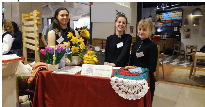
Tukuma 2.vidusskolas skolēnu mācību uzņēmuma pārstāves pasākumā "CITS BAZĀRS pavasarī 2019".

Tukuma 2.vidusskolas skolēnu mācību uzņēmuma piedāvājuma klāstā bija tamborētas sedziņas, ziedu un konfekšu pušķi un citas pašu darinātas preces.