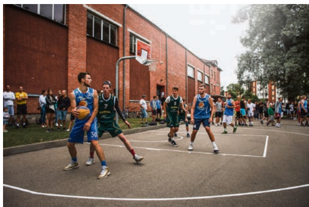
3x3 Tukuma ielu basketbols