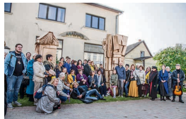
Kopbilde pie grāmatu totēma.