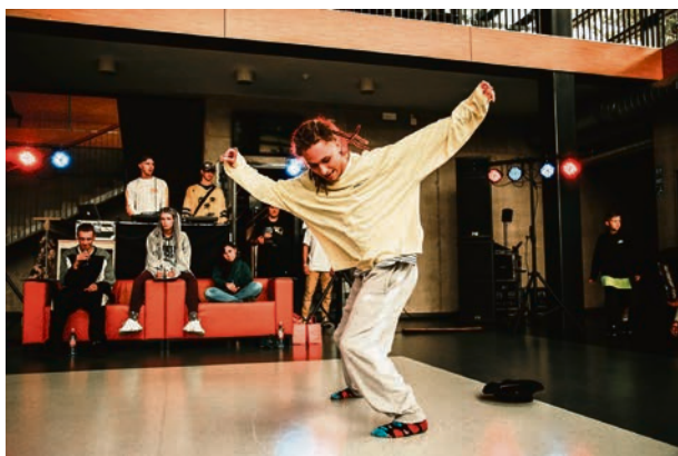
Ielu deju sacensības "Summer dance battle"