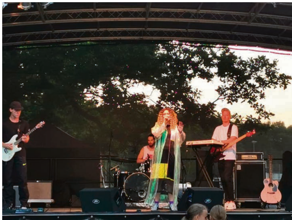
Grupas "Triānas parks" koncerts