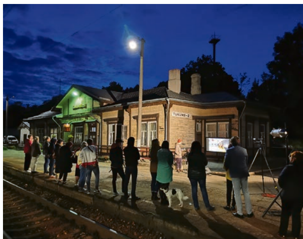
Sirds uz perona.

Divas dienas pēc kārtas – 11. un 12. septembrī – Tukumu pieskandināja dzeja. Piektdienas vakarā stacijā "Tukums II" notika akcijas "Sirds uz perona 10 gadi" pasākums. Jubilejas gadā akcija piedzīvoja vēl nebijušus mērogus – dzeju dzelzceļu malā vienlaikus lasīja 14 valstīs: Latvijā (16 stacijās), Austrālijā (2), Francijā (2), Vācijā (dzeju lasīja arī Latvijas vēstniece Vācijā Inga Skujiņa), Austrijā, Beļģijā, Itālijā, Spānijā (latviešu dzejas atdzejotāja spāņu valodā lasīja Astrīdes Ivaskas un Leona Brieža dzeju), Norvēģijā, Anglijā (2), Skotijā, Īrijā, Islandē un ASV. Četras Latvijas stacijas un gandrīz visas ārvalstis cita pēc citas saslēdzās video tiltā: dzīvos dialogos sarunājās Tukums un Rīga, Tukums un Spānija, u.c. Sajūtas bija neaprakstāmas: visā pasaulē vienlaikus lasa latviešu dzeju un visus vieno sliedes vai lielceļš kā dzīvs asinsvadu tīklojums. Un Tukums ir ass, ap kuru rotē šis milzu notikums. Kā milzu notikumu to latviešu un angļu valodās aprakstīja www.lsm.lv publikācijā "Ar nebijušu aizrautību latvieši visā pasaulē piedalās akcijā "Sirds uz perona"" https://www.lsm.lv/raksts/kultura/literatura/ar-nebijusu-aizrautibu-latviesi-visa-pasaule-piedalas-dzejas-akcija-sirds-uz-perona.a374185/