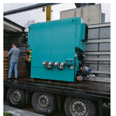
Jaunie apkures katli Slampes un Džūkstes katlu mājās

TL: Nobeigumā – kāds būtu jūsu novēlējums šo piecu pagastu iedzīvotājiem?