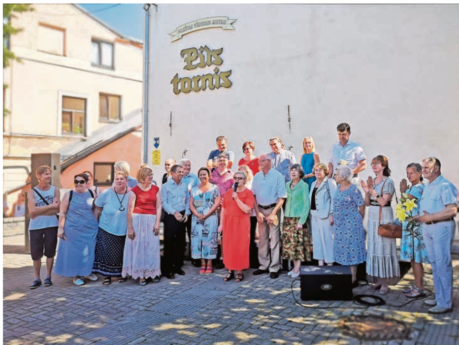
Ceļojums uz viduslaikiem