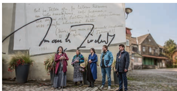
KDzD atklāšana.