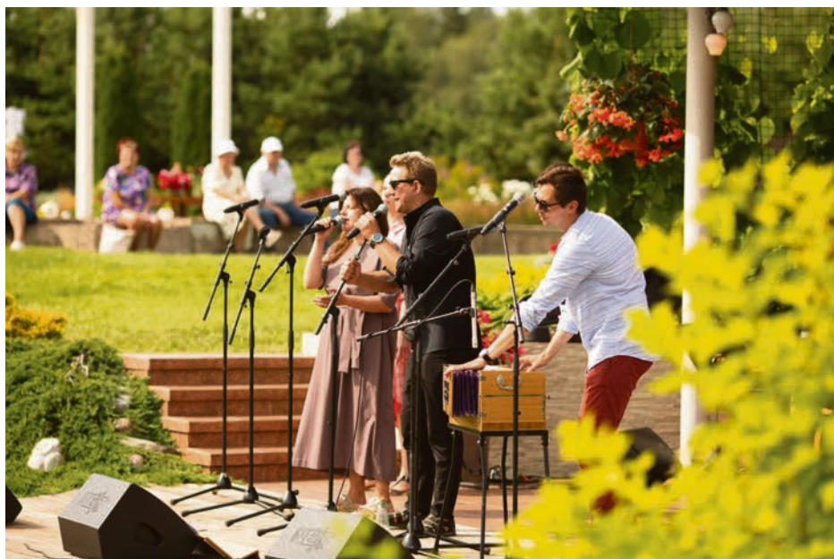
Dārza svētki "Rozītēs"