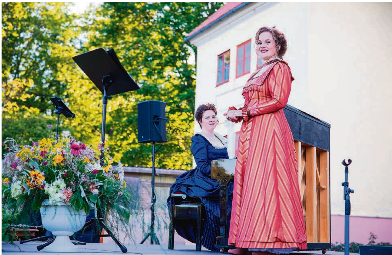
Kamermūzikas koncerts Durbes pilī