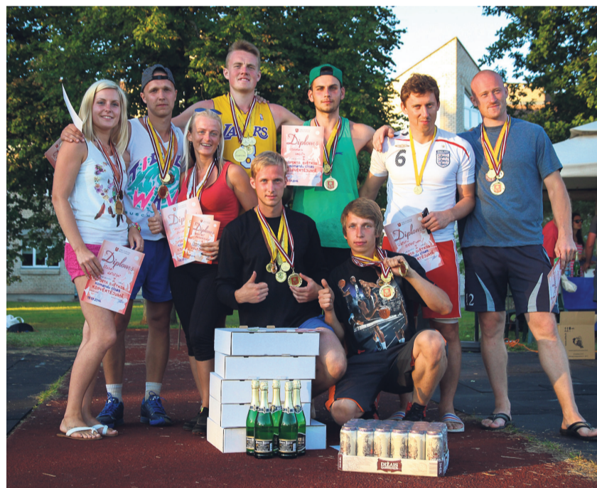
Foto: Jauniešu uzvarētāju komanda Tumes Sporta svētkos 2014. gadā