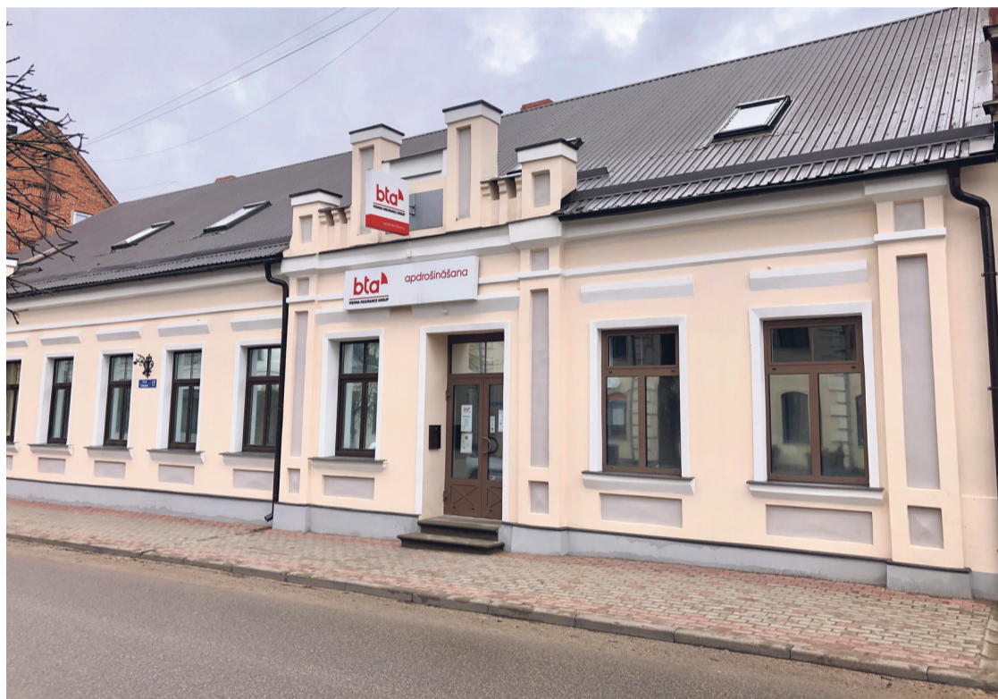
"Klientu apkalpošanas centrs BTA", Pils ielā 12, Tukumā, pagājušā gada ietvaros saņēma no pašvaldības līdzfinansējumu ēkas fasādes atjaunošanai

Darbiem, kas pārveido kultūras pieminekli, tā teritoriju vai aizsardzības zonu, nepieciešama Nacionālā kultūras mantojuma pārvaldes atļauja, un ar informāciju par