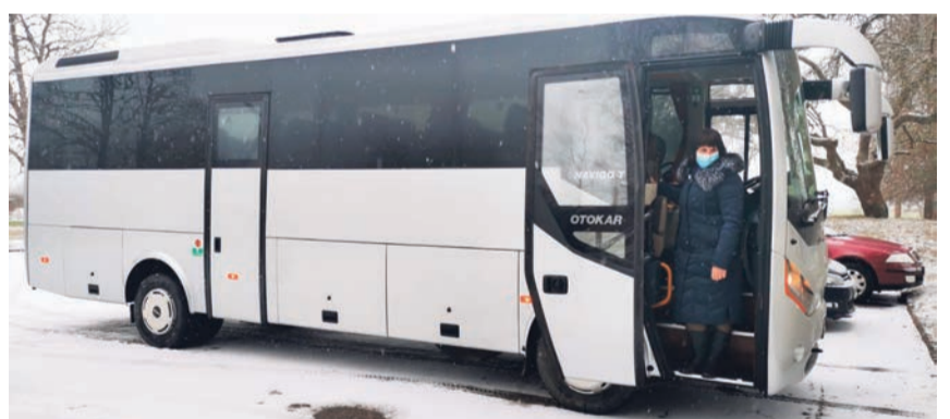
Autobuss Slampes un Džūkstes pagastu pārvaldei