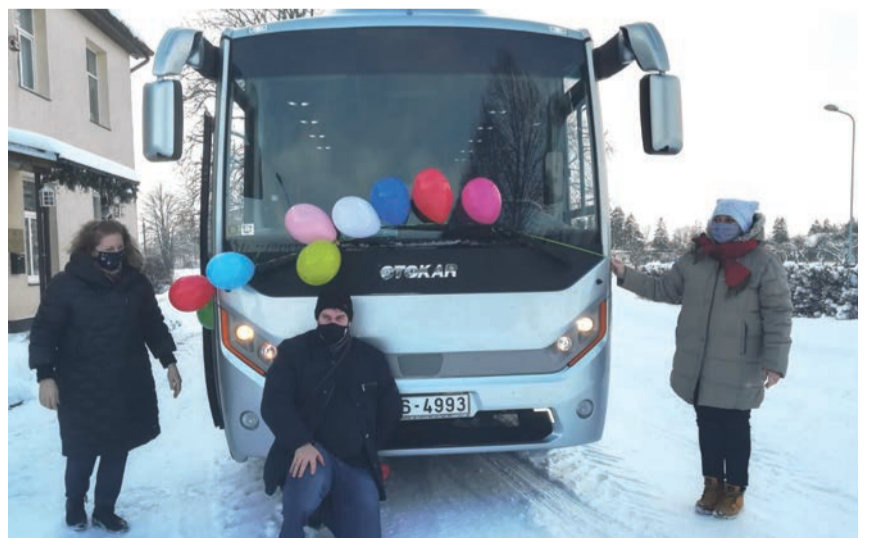
Autobuss Pūres un Jaunsātu pagastu pārvaldei