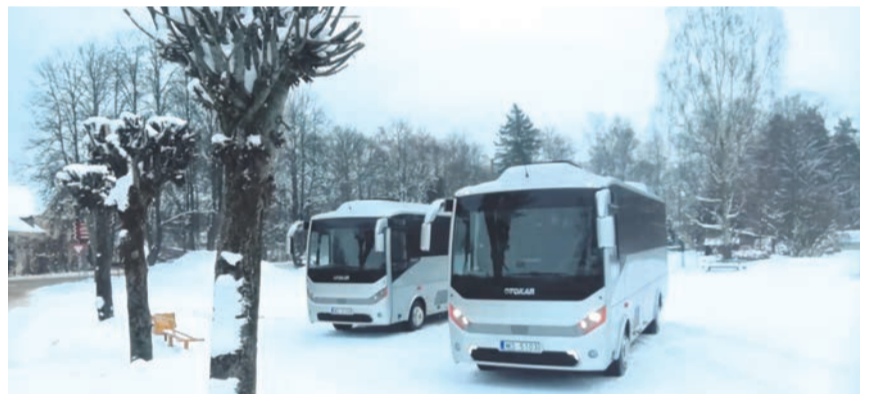
Jaunie autobusi Irlavas un Lestenes pagastu pārvaldei.