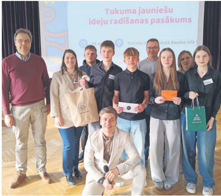
Pirmās vietas ieguvēji – komanda "Zaļās zvaigznes"