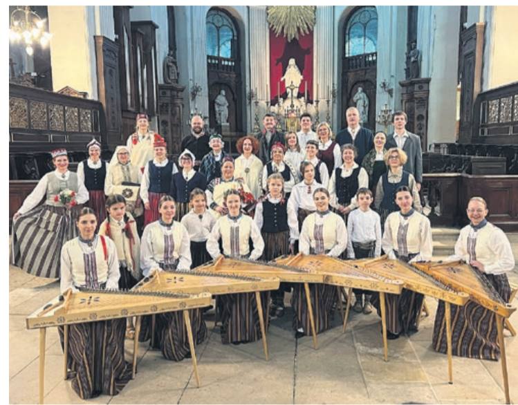
Engures Mūzikas un mākslas skolas koklētāju ansamblis "Sidrabs" Parīzē

Galvenais notikums – koncerts 8. martā – notika Parīzes vēsturiskā centra pašā sirdī, baznīcā "Notre-Dame des Blancs-Manteaux". Pirms koncerta klausītājiem tika piedāvāta latviešu maizes no "Lāču" ceptuves un veselības dzēriena degus-