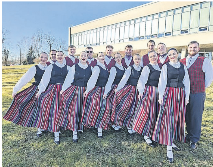
Vidējās paaudzes deju kolektīvs "Urda" skatē ieguva I pakāpi

Matkules Kultūras nama vidējās paaudzes deju kolektīvs "Urda" Tukuma novada un Jūrmalas valstspilsētas IX Vidējās paaudzes deju svētku deju koprepertuāra pārbaudes skatē ieguva I pakāpi. Matkules amatierētris "Jauda" gatavojas "Gada izrāde 2024" reģionālajai skatei ar izrādi "Nebēdnieki". Savukārt vokālais ansamblis aktīvi gatavojas Vokālo ansambļu skatei 12. aprīlī Lapmežciema Tau-