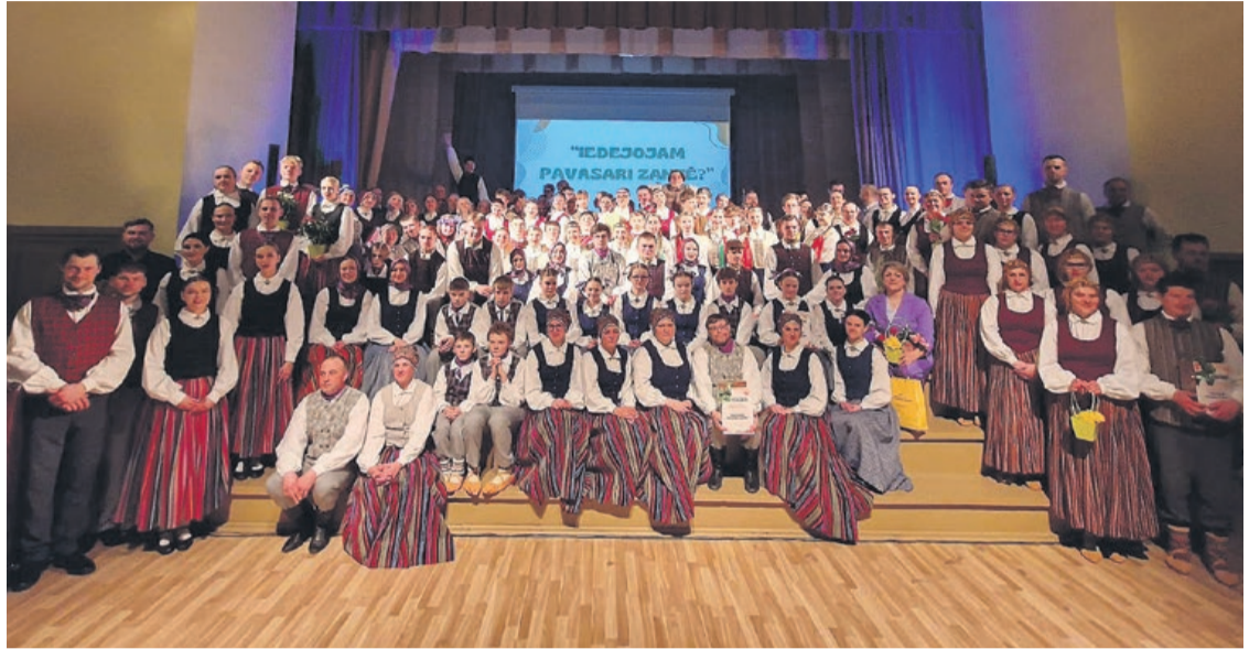
Koncerta "Iedejojam pavasari Zantē" dalībnieku kopbilde.

Biedrība "Dzirnavstrauts" jau no janvāra realizē projektu "Ceļā uz viedo ciemu un viedu kopienu Zemītes pagastā". Projekta mērķis ir veicināt Zemītes pagasta iedzīvotāju līdzdarbību kopienu dzīves vides un labbūtības veidošanā, izglītojumus un ieteikumus, kurus attīstīt Zemītes pagastā uzņēmējdarbībā, sociālajā jomā, tehnoloģijās.