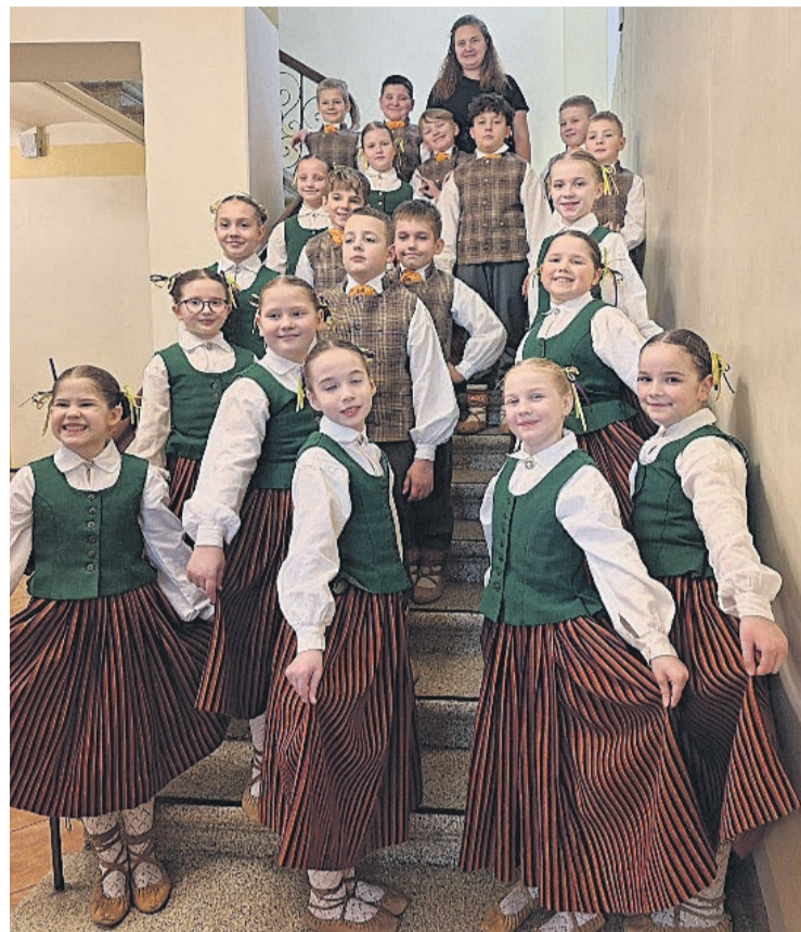
Smārdes pamatskolas deju kolektīvs “Dzēvītes” pēc lieliski aizvadītas XIII Skolēnu Dziesmu un deju svētku skates

• Milzkalnes sākumskolā notiek cenu aptauja par asfaltētā mini stadiona rekonstrukciju