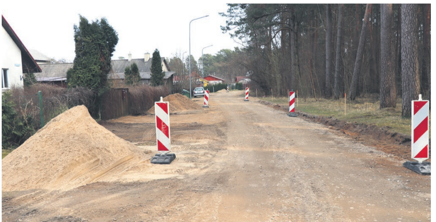
Būvdarbi Lazdu ielā, Tukumā

Šobrīd notiek iepirkuma procedūra par būvdarbu veikšanu Raudas ielas posma rekonstrukcijai no Tukuma 2.vidusskolas līdz īpa-