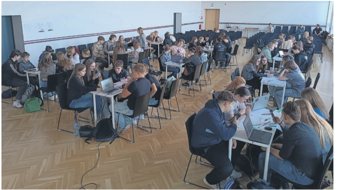
Visi dalībnieki darba procesā

19. martā Tukuma 2. vidusskolā notika jauniešu ideju radīšanas pasākums "Tīri.Labi.Aprītē", kurā 10 komandas no Džūkstes, Zantes, Irlavas, Lapmežciema un Tukuma izstrādāja risinājumus pārtikas atkritumu samazināšanai un lietu atkārtotai izmantošanai. Jaunieši piedāvāja dažādas idejas – no pārtikas izšķērdēšanas samazināšanas skolās un mantu apmaiņas punktu izveides līdz bioloģisko atkritumu kompostēšanai, ekotransporta labošanas stacijām un aplikācijām būvmateriālu vai pārtikas dalīšanai. Katra ideja bija vērsta uz konkrētas vides problēmas risināšanu, bieži ietverot gan pārdomātus, gan praktiskus rīcības soļus. Žūrija, kas izvērtēja jauniešu idejas, sniedza ieteikumus to uzlabošanai, lai līdz 30. martam tās varētu iesniegt Tukuma novada pašvaldības jauniešu iniciatīvu konkursā.