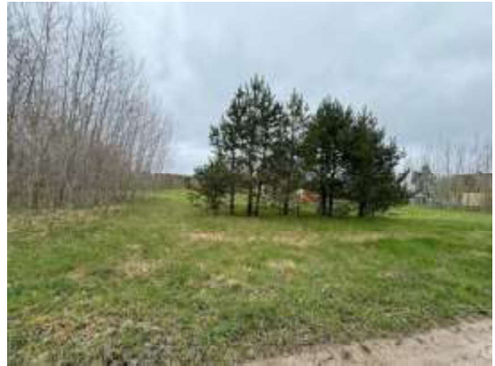
Skats uz zemes gabalu