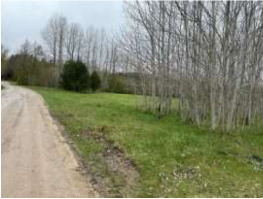
Skats uz zemes gabalu