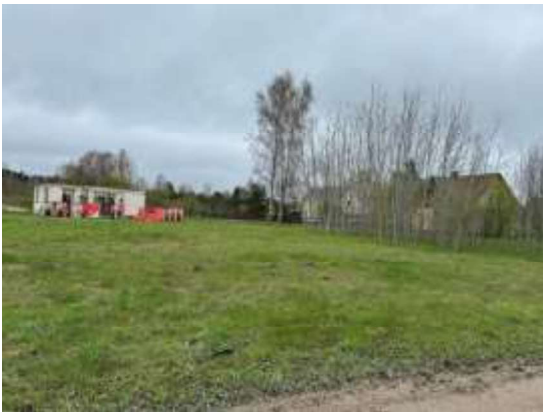
Skats uz zemes gabalu