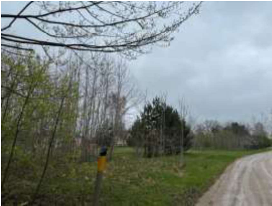
Skats uz zemes gabalu