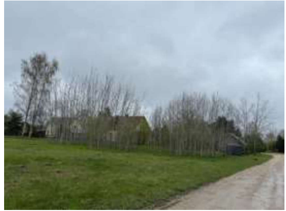
Skats uz zemes gabalu