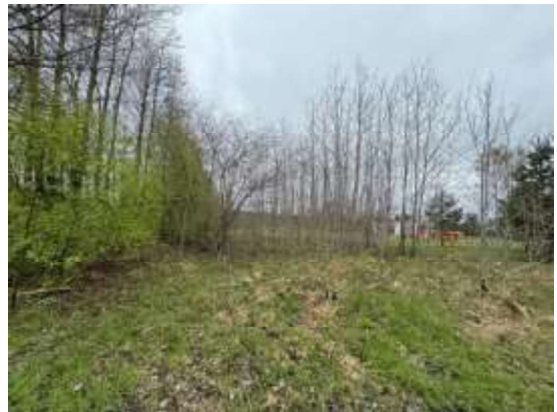
Skats uz zemes gabalu