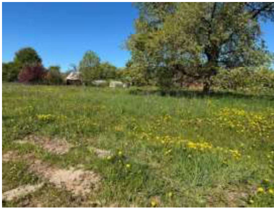
Zemes vienība 9011 001 1070