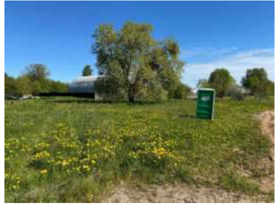
Zemes vienība 9011 001 1070