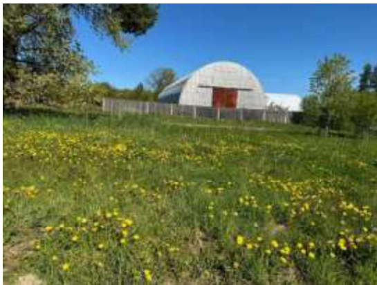
Zemes vienība 9011 001 1070