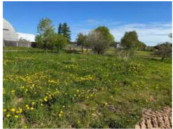
Zemes vienība 9011 001 1070