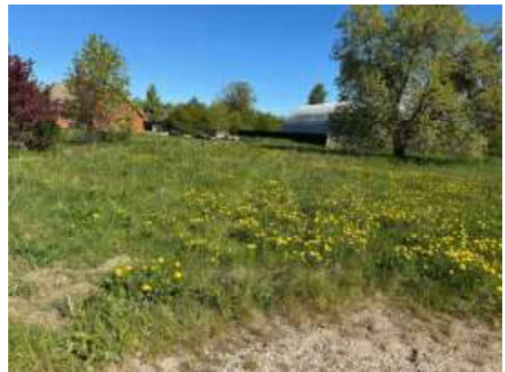
Zemes vienība 9011 001 1070