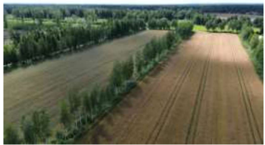
Zemes gabals 9096 001 0038