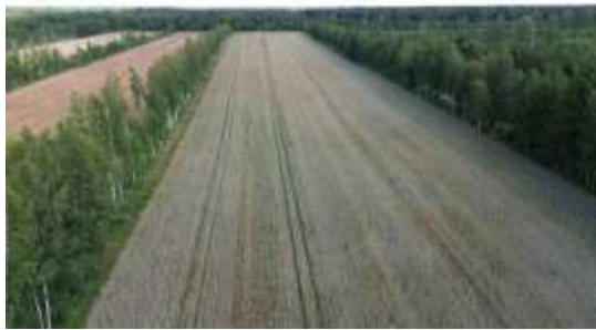
Zemes gabals 9096 001 0038