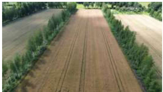
Zemes gabals 9096 001 0038