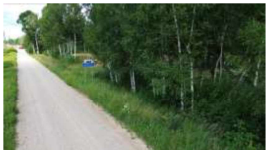
Ceļš pie īpašuma