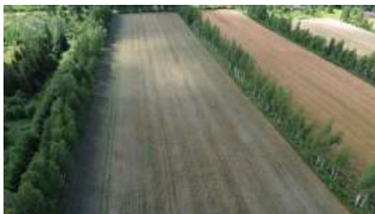
Zemes gabals 9096 001 0038