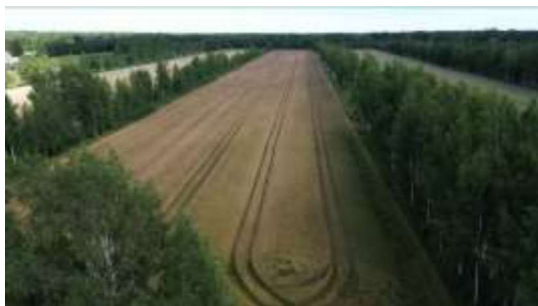
Zemes gabals 9096 001 0038