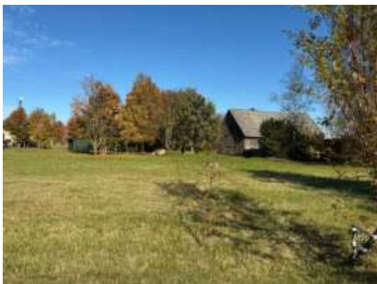
Zemes vienība 9044 005 0188