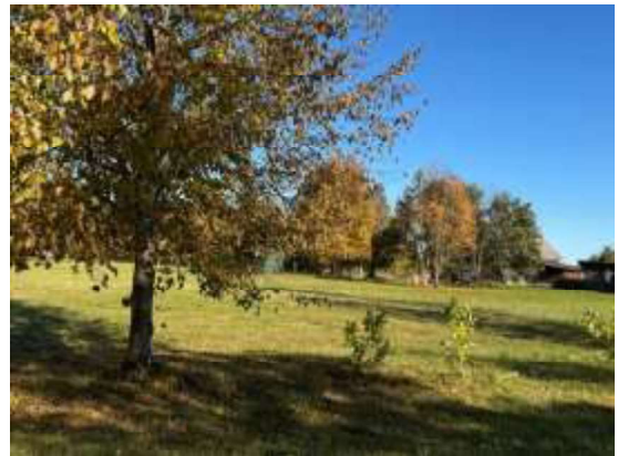
Zemes vienība 9044 005 0188