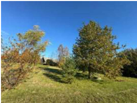
Zemes vienība 9044 005 0188