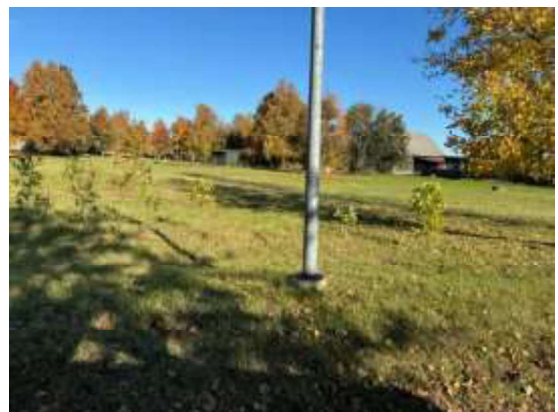
Zemes vienība 9044 005 0188