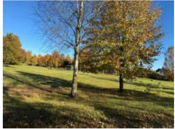
Zemes vienība 9044 005 0188