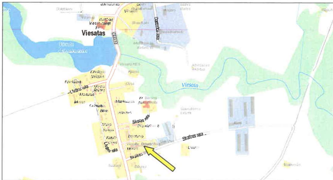
Dzīvokļa Nr.1, Tukuma novadā, Viesītu pagastā, Viesītas, "Draudzības" tirgus vērtības noteikšana