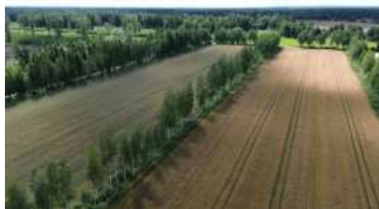
Zemes gabals 9096 001 0038