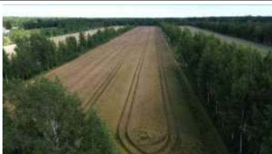
Zemes gabals 9096 001 0038