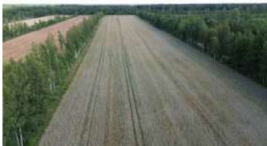
Zemes gabals 9096 001 0038