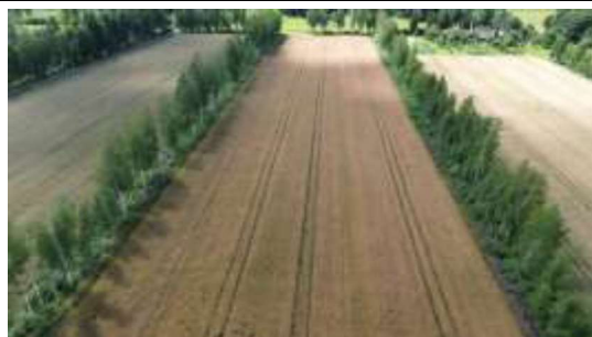
Zemes gabals 9096 001 0038