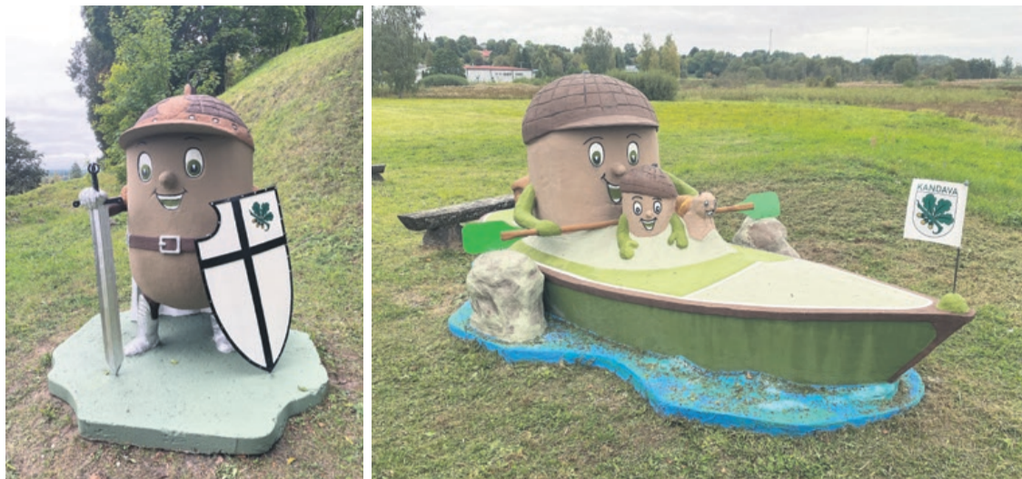
Kandavas Ziluku figūras ieguvušas jaunu krāsojumu

Kandavas un pagastu apvienība turpina mērķtiecīgi strādāt pie pilsētas labiekārtošanas un infrastruktūras uzturēšanas, veicot saimnieciskos darbus.