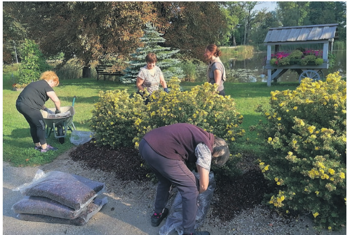
Zemītnieki atjauno mulčas segumu apstādījumu dobēs

Projektu Nr. TND/2-58.5/24/257 "Zemītes pagasta atpūtas laukuma labiekārtošana pie "Cerībām" Zemītes pagasta aktivisti īstenoja ar nodibinājuma "Kandavas novada iespēju fonds" atbalstu. 90 % no projekta finansējuma piešķīra Tukuma novada pašvaldība. Arī šis projekts ir veiksmīgi noslēdzies. Projekta ietvaros tika paredzēts sakārtot Zemītes pagasta atpūtas laukumu pie "Cerībām", kas atrodas pagasta centrā starp Zemītes pagasta pārvaldi, bibliotēku un Tautas namu. Tajā atrodas apstādījumi un bērnu rotaļu laukums, kā arī atpūtas vieta pie ezera ar āra kamīnu. Šī ir iecienīta atpūtas vieta gan pagasta iedzīvotāju, gan viesu vidū. Laikam ritot, šī teritorija prasīja sakopšanu un uzlabojumus, kurus projekta darba grupa arī īstenoja. Tika nostiprināts kamīna pamats, lai novērstu kamīna apgāšanos, atjaunots mulčas segums apstādījumu dobēs, un izvietotas 4 solārās laternas atpūtas laukumā, lai apgaismotu bērnu rotaļu laukumu un kamīnu. Kad izvērtējām laternu gaismas pārklājumu, secinājām, ka lieliski būtu iegūt vēl 3 iden-