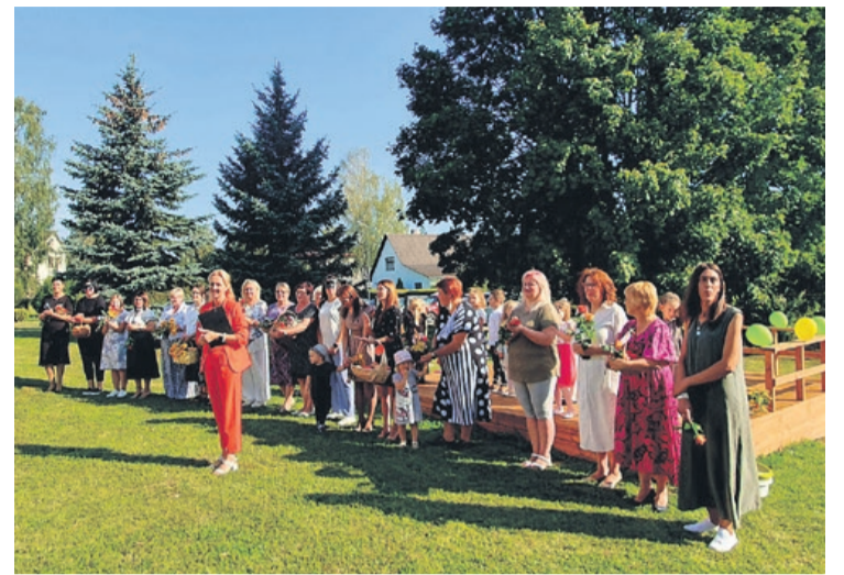
Zinību diena pirmsskolas izglītības iestādē "Pienenīte"

Pēc iestādes padomes ierosinājuma un atsaucoties vecāku vēlmei vairāk iesaistīties bērnudārza dzīvē, 13. septembrī notika Labo darbu diena. Lai gan laikapstākļi šajā dienā īpaši nelutināja, vecāku aktivitāte, atsaucība un neatlaidība bija apbrīnojama. Rezultātā no paletēm tika pagatavoti soli, kurus varēs izvietot pie jaunās estrādes, un uzsākti vienas āra nojumes labiekārtošanas darbi. Milzīgs, sirsnīgs paldies visiem, kuri veltīja savu laiku, materiālus, labo gribu un palīdzēja realizēties vienai no iecerēm!