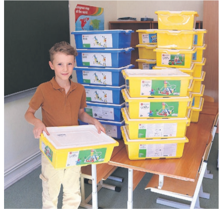
Robotikas komplekti Jaunpils vidusskolā

Projekta kopējās izmaksas ir 14 830,87 EUR, no kurām ELFLA atbalsta finansējums ir 11 864,70 EUR un Tukuma novada pašvaldības līdzfinansējums – 2669,55 EUR. Sakām sirsnīgu paldies par atlikušās