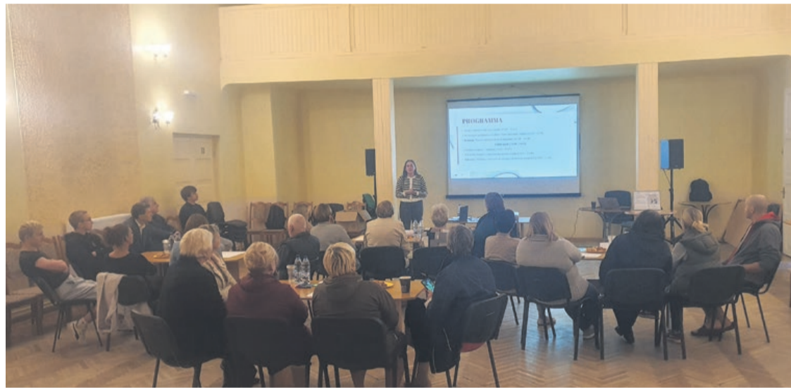
Diskusijas laikā tika meklēti risinājumi transporta problēma

25. septembrī vairāk nekā 20 Vānes iedzīvotāji un pieci Kurzemes plānošanas reģiona speciālisti sanāca kopā Kultūras namā, lai diskutētu un meklētu risinājumus transporta problēmai. Pasākums noti-