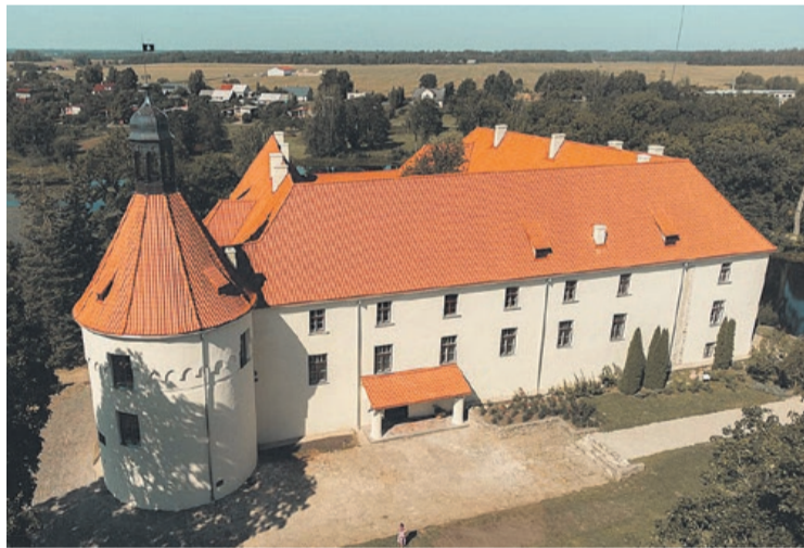
Jaunpils pils pēc atjaunošanas darbiem

Jaunpils pils, viens no ievērojamākajiem Tukuma novada un Latvijas kultūras pieminekļiem, gada laikā piedzīvoja būtiskus atjaunošanas darbus, kas bija nepieciešami un nekavējoties uzsākti pēc postošās 2023. gada 7. augusta vētras radītajiem bojājumiem. Tukuma novada pašvaldība ir gandarīta paziņot, ka darbi ir veiksmīgi pabeigti šī gada septembrī. Pils ir pilnībā sagatavota, droša un pieejama apmeklētājiem.