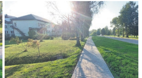
Izbūvētā gājēju ietve Skolas ielā, Zantē