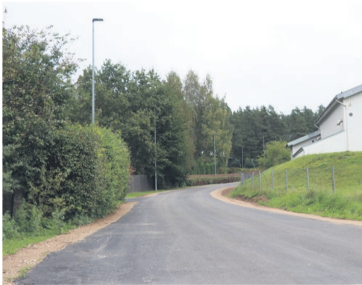
Izbūvēts asfalta segums Ozolu ielā

Septembrī Tukumā pabeigta Pilādžu un Ozolu ielu pārbūve, veicot asfalta segas izbūvi un nesošo pamatu pastiprināšanu 0,580 km garumā. Papildus pārbūvēta arī esošā sadzīves kanalizācijas sistēma. Rezultātā ir uzlabota ne vien ielu ilgtspēja, bet arī radīti ērtāki dzīves apstākļi ie-