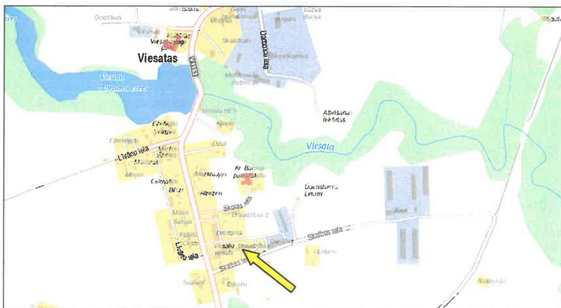
Dzīvokļa Nr.9, Tukuma novadā, Viesatu pagastā, Viesatas, "Draudzības" tirgus vērtības noteikšana