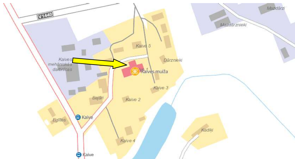
Dzīvokļa Nr.5, Tukuma novadā, Sēmes pagastā, Kaivē, "Kaive 1" tirgus vērtības noteikšana