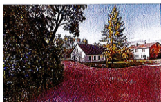
Snapji Autobusa pietura

https://www.google.com/maps/place/Snapji/@56.8635771,22.9916688,15z/data=!4m6!3m5!1s0x46e1078cd11668137:0xa5b19eb9ba77e274!8m2!3d56.8489776!4d22.9857894!16s%2F11h79m647e!entry=tlu