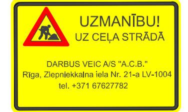
- Būvniecības brīdinājuma plakāts