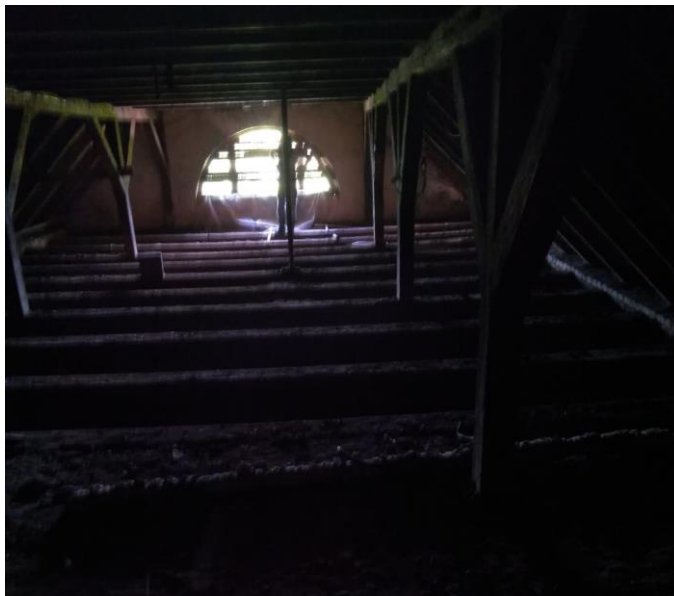
1. attēls - Spāru, uzspāres, siju gali un mūrlata būvdarbu sākumā. Asīs 2/7-A/C

Kopējās darbu izmaksas 48771,61 EUR (četrdesmit astoņi tūkstoši septiņi simti septiņdesmit viens eiro, 61 cents) no kurām Nacionālās kultūras mantojuma pārvaldes finansējums 5000,00 EUR (pieci tūkstoši eiro).