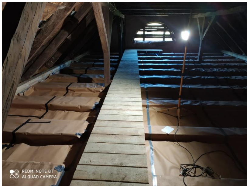
2.attēls – Koka konstrukciju nostiprināšana un pārseguma sagatavošana siltināšanai.