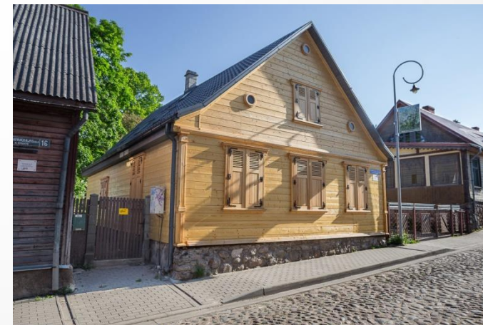
Nams 2016. gada maijā