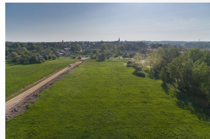
Tukums, 2016. gada maijs