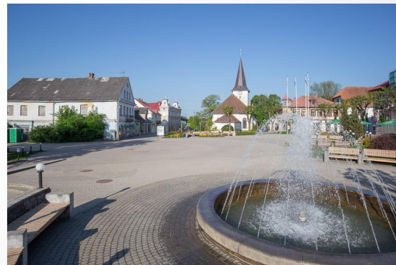
Brīvības laukums ar strūklaku 2016. gada maijā