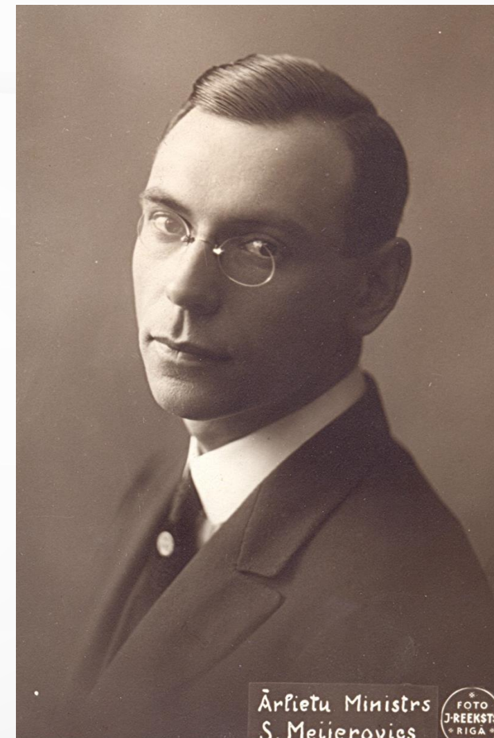
Z. A. Meierovica portrets, 1920

Tā būs vieta, kur atdot godu mūsu priekšgājēju pašreizējai un ideāliem, kuriem viņi ticēja un kuros pamatojas mūsu valsts un mūsu brīvība. Vieta, kur klusi izjautāt arī pašu šodienas sirdsapziņu.