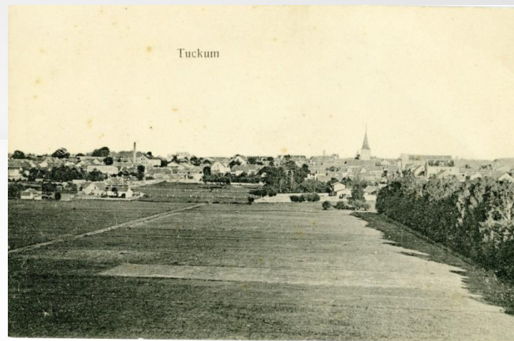
Tukums 20. gs. sākumā. Pastkarte

Šīs iniciatīvas mērķis ir dāvēt paliekošu vērtību Tukuma pilsētai, novadam un visai Latvijai.