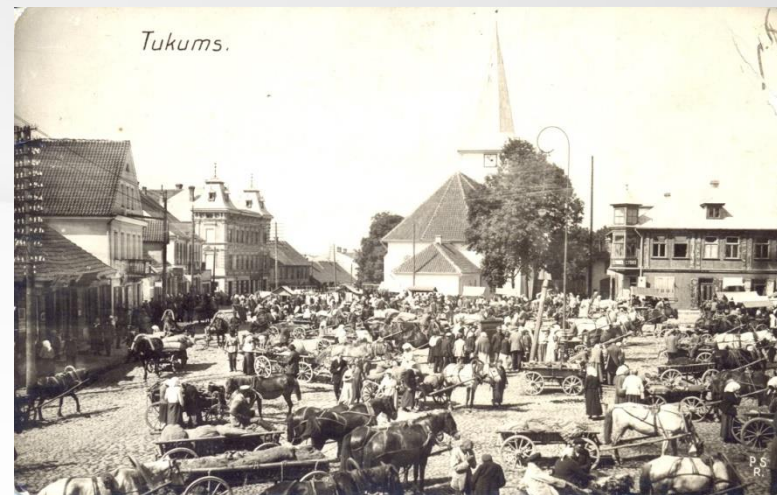
Agrākais tirgus laukums Tukumā, 20. gs. sākums

Pēc Latvijas Republikas neatkarības atjaunošanas tas tika nojaukts un laukums ieguva savu tagadējo nosaukumu.