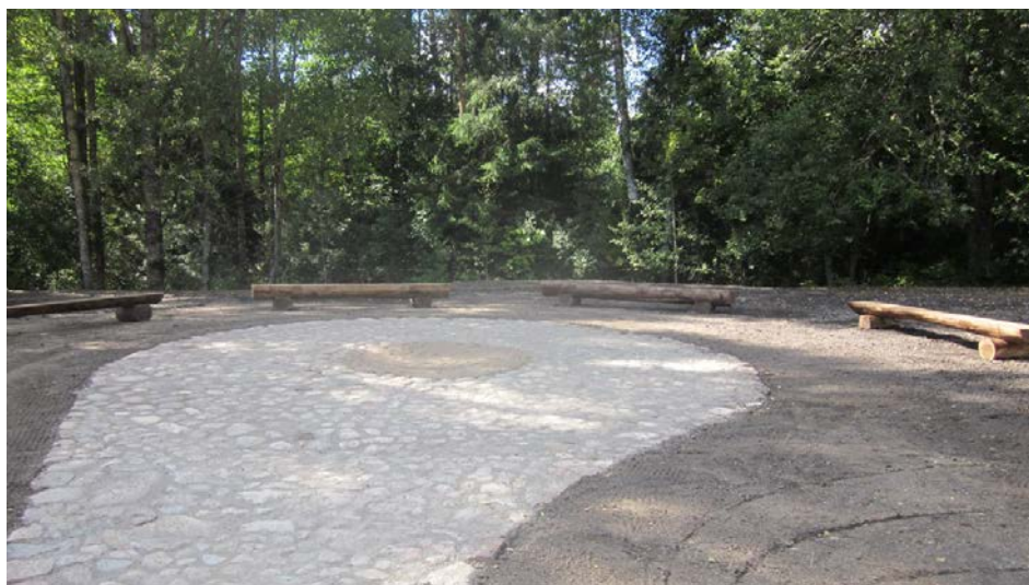
Sēmes pagasta tautas nama teritorijas labiekārtošana ar ugunsкура vietu