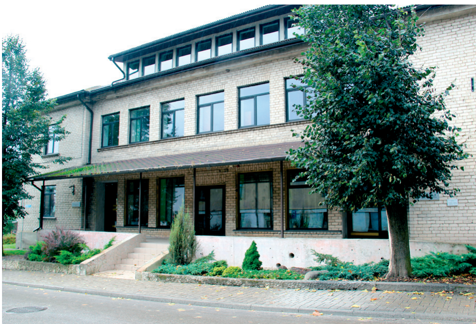
Tukuma novada sociālais dienests Tidaholmas ielā 1