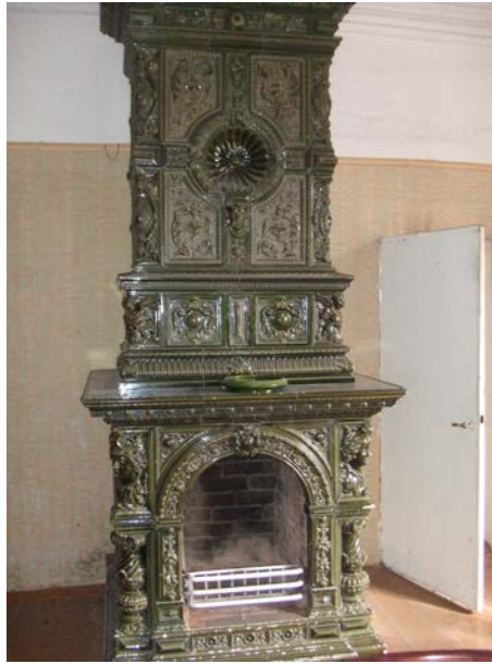
Saglabātā podiņu krāsns „Lāčplēšu” mājās

Darbs ir uzsākts, un tas ir jāturpina. Tāpēc tiek lūgti iedzīvotāji atbalstīt šo akciju un piedalīties gan pašiem, gan zvanot uz bibliotēku un piedāvājot informāciju. Palūkojieties sev apkārt un nofotografējiet savu mājvietu (sīkāka instrukcija bibliotēkā), meklējiet vecos dokumentus, iztaujājiet savus radniekus un dodieties uz bibliotēku, kur darbinieki jūs uzklausīs, noskenēs dokumentus un fotogrāfijas, tad tos tālāk nosūtīs ievietošanai datu bāzē. Ja šoruden katrs, kurš sevi uzskata par Latvijas vai savas dzimtas vietas