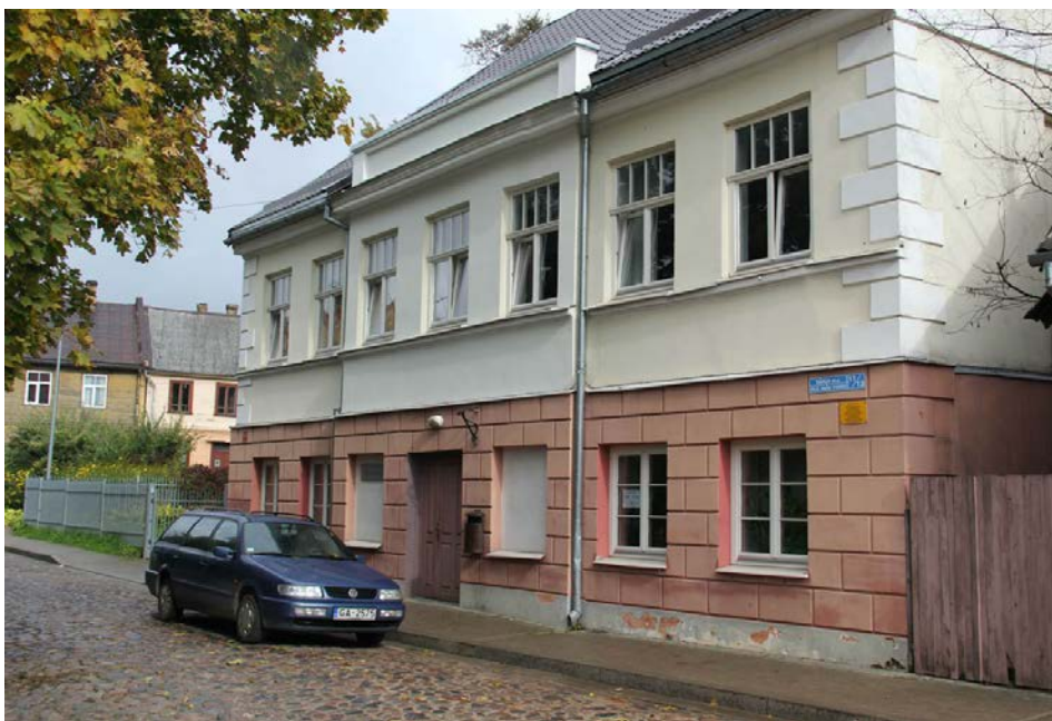
Tukuma novada patversme

Jauniešu sociālais centrs (Tidaholmas ielā 1, Tukumā) sniedz sociālās rehabilitācijas pakalpojumus Tukuma novadā dzīvojošiem bērniem un jauniešiem vecumā no 7 līdz 18 gadiem ar uzvedības problēmām. Jauniešu centra uzdevums ir organizēt pašvaldībā bērnu un jauniešu brīvā laika lietderīgo izmantošanu un nepilngadīgo likumpārkāpēju individuālo profilaksi. Jauniešiem tiek piedāvāta neformālā izglītība, rokdarbu, kulinārijas un sporta nodarbības. Katru gadu tiek organizētas 4 nometnes sociālā riska