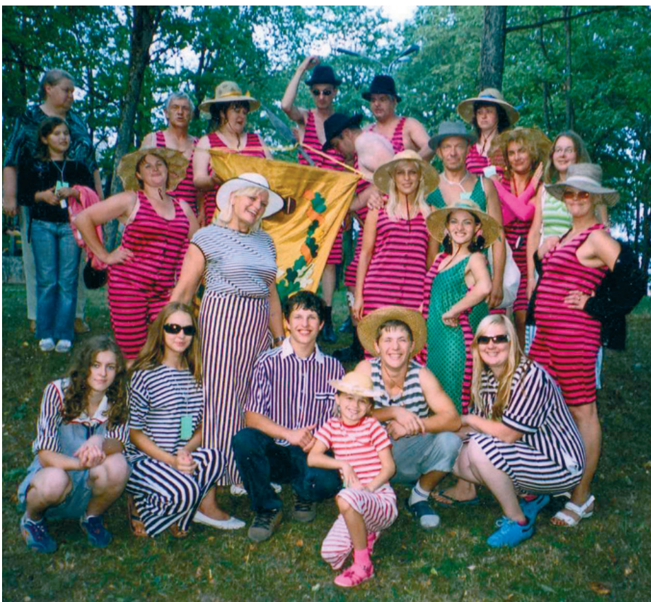
Tukuma teātra atraktīvais kolektīvs

tas ir vaļasprieks, nevis pamatdarbs. Katram ir sava nodarbošanās un mūsdienās jau tā nevar kā senāk, kad kultūras nams uzrakstīja atbrīvojumu no darba. Teātris piedalās arī dažādos uzvedumos, piemēram, sadarbojoties ar muzeju, piedalījušies muzeja naktīs, lasījuši pasakas Audēju darbnīcā, piedalījušies viņu sausto tērpu demonstrēšanā, izpalīdzējuši Jaunmoku pili, veidojot veco laiku atmosfēru utt. Kolektīvs nav lepns, un vienmēr gatavi sadarboties ar visiem, kuri lūdz palīdzību.