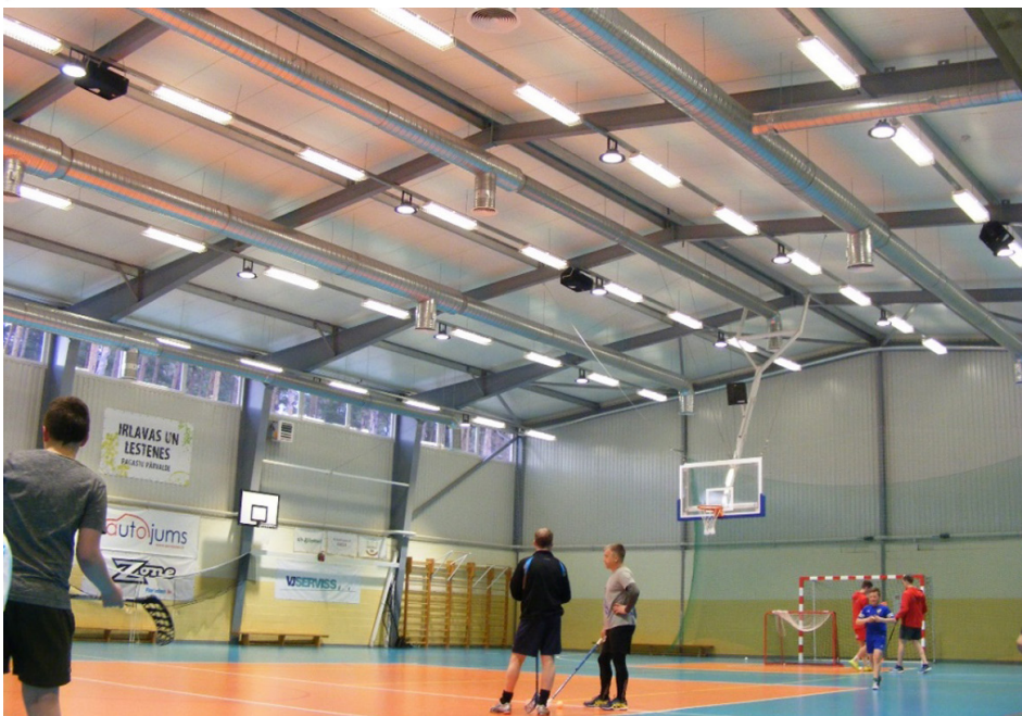
Attēls: Irlavas sporta nama zāle ar jaunajiem LED gaismekļiem

Atbalsta Zemkopības ministrija un Lauku atbalsta dienests