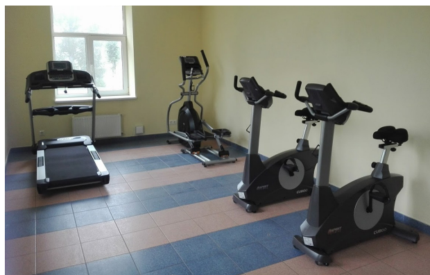
Trenāžieri Sēmes kopienas centra fizioterapijas kabinetā turpinājums 12.lpp.

Atbalsta Zemkopības ministrija un Lauku atbalsta dienests