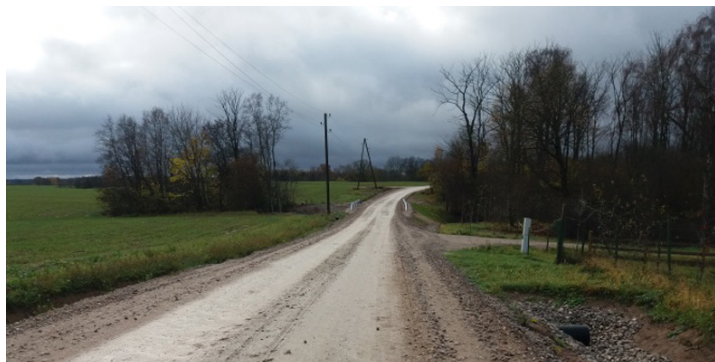
Rotkaļi–Vecmokas ceļu posms