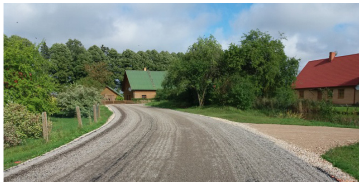
Krūmiņi–Atpūtas pretputekļu segums