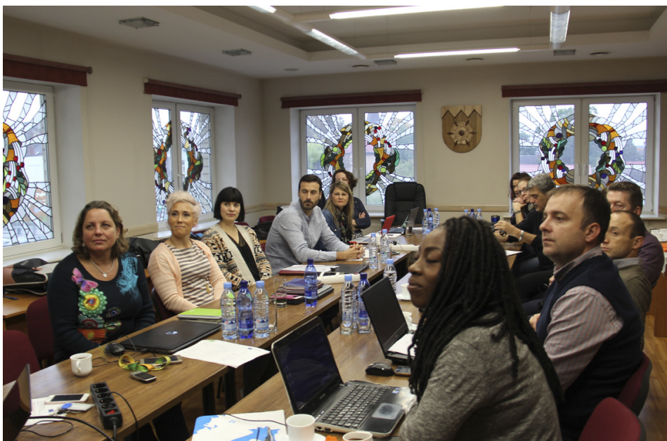
Darba grupa tikšanās reizē Tukumā

Tukums prezentēja šogad veiktās daudzās aktivitātes – Sporta un Veselības dienu, Olimpisko dienu, deputātu velobraucieni, skolēnu iesaistišanu peldētāpmācībā, veselīga uztura nometnes u.c. Nākamajā gadā papildus jau šīm aktivitātēm pie āra trenāžieriem tiek plānots uzstādīt standus ar informāciju, kā pareizi tos izmantot, tā-