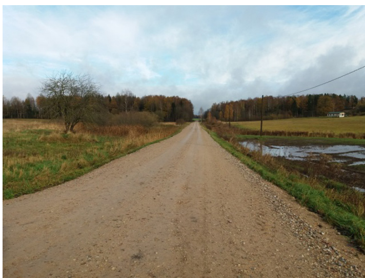
Beitīņi-Liepsalas ceļa posms ar pretputekļa segumu un Beitīņi-Liepsalas ceļa posms

Pašvaldība īsteno Eiropas Lauksaimniecības fonda lauku attīstības pasākuma “Pamatpakalpojumi un ciematu atjaunošana lauku apvidos” projektu “Pašvaldības autoceļu pārbūve Tukuma novada Pūres un Jaunsātu pagastā” Nr. 17-08-A00702-000034, kura ietvaros 2017. gada 3. novembrī ekspluatācijā nodots pašvaldības autoceļa posms Beitīņi–Liepsalas no 0,00 km līdz 1,8 km, Pūres pagastā.