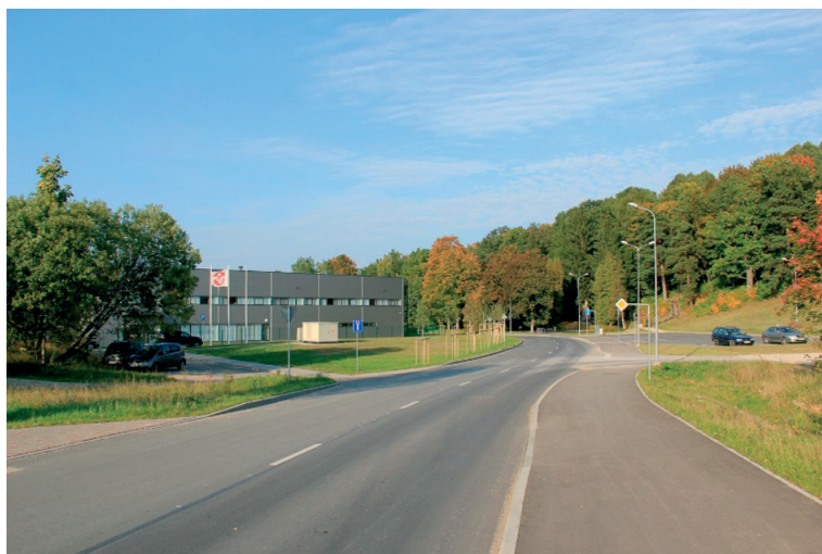
Melnezera iela un Putniņu iela