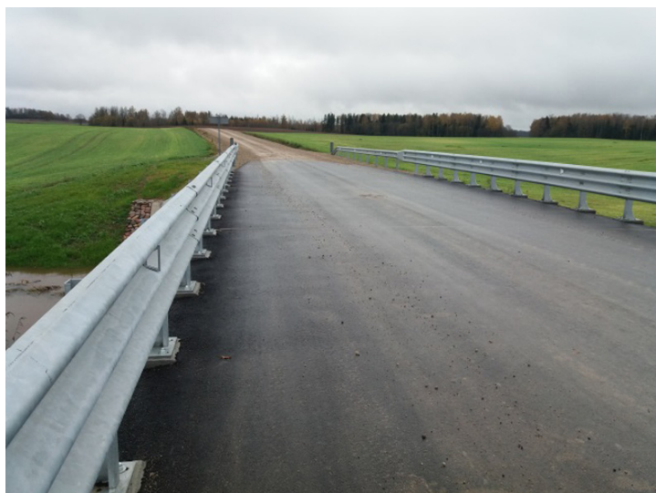
Tilts pār Pūres upi